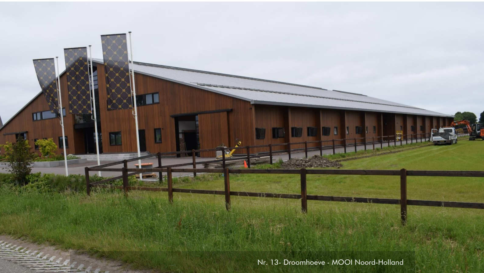
Nr. 13- Droomhoeve - MOOI Noord-Holland