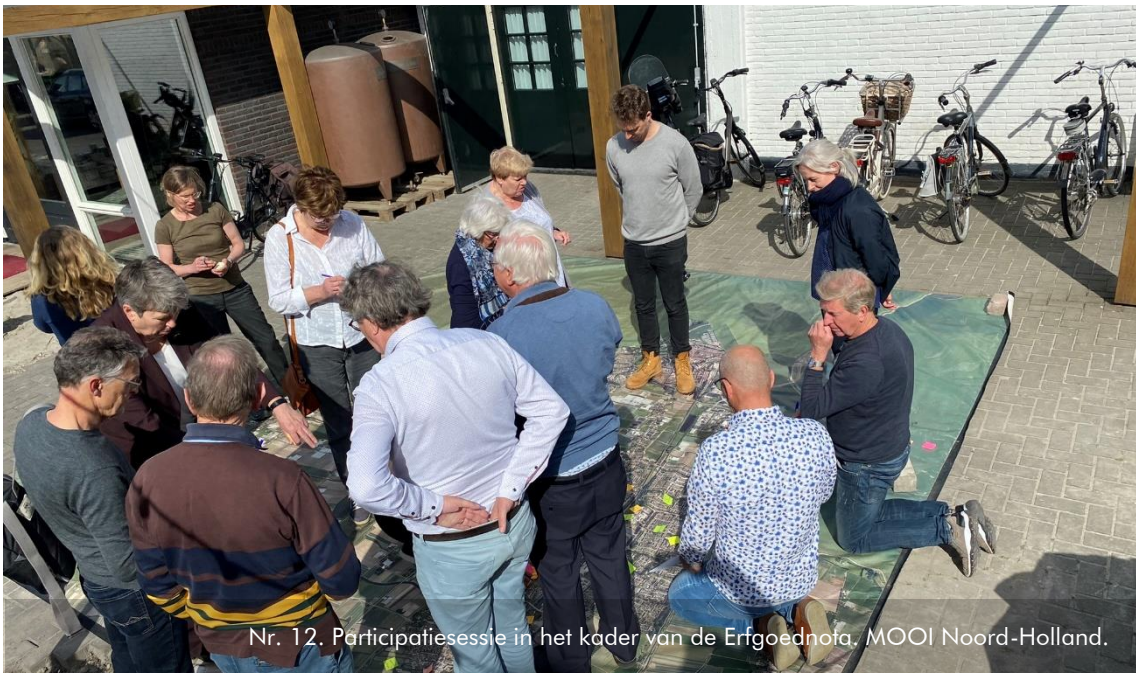
Nr. 12. Participatiesessie in het kader van de Erfgoednota, MOOI Noord-Holland.