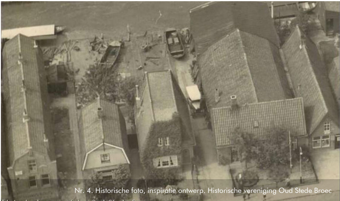
Nr. 4. Historische foto, inspiratie ontwerp.