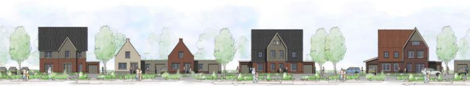
Nr. 5. Woningen in het eindontwerp - Studio DWP