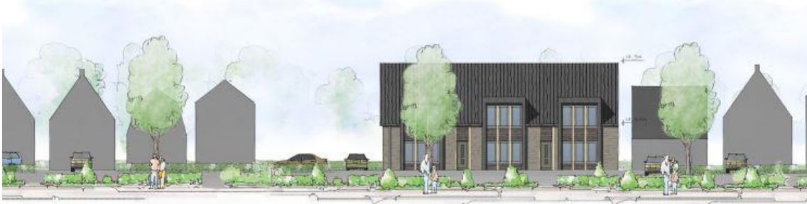
Nr. 3. Eerste ontwerp. De Wolff & Partners

parkeerplaatsen boden daarbij niet het beloofde groen en blokkeerden het doorzicht. Na een aantal studies is gekomen tot een gebouw dat refereert aan de typische bedrijfsbebouwing. Doordat het in traditioneel rood baksteen wordt opgetrokken, is voorzien van een mansardekap en haaks op de Broekerhavenweg is gesitueerd wordt de schaalvergroting op een logischer wijze opgenomen in de omgeving.