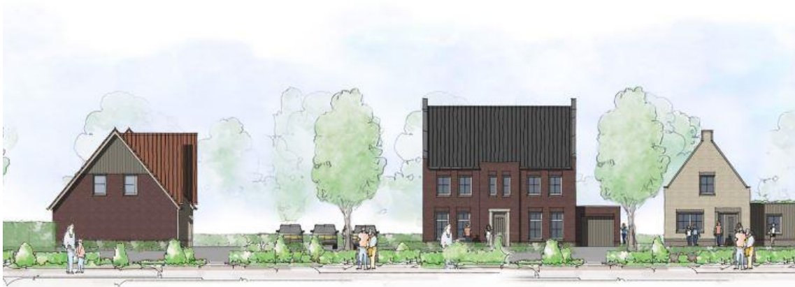
Nr. 8. Woningen in het eerste ontwerp. Studio DWP