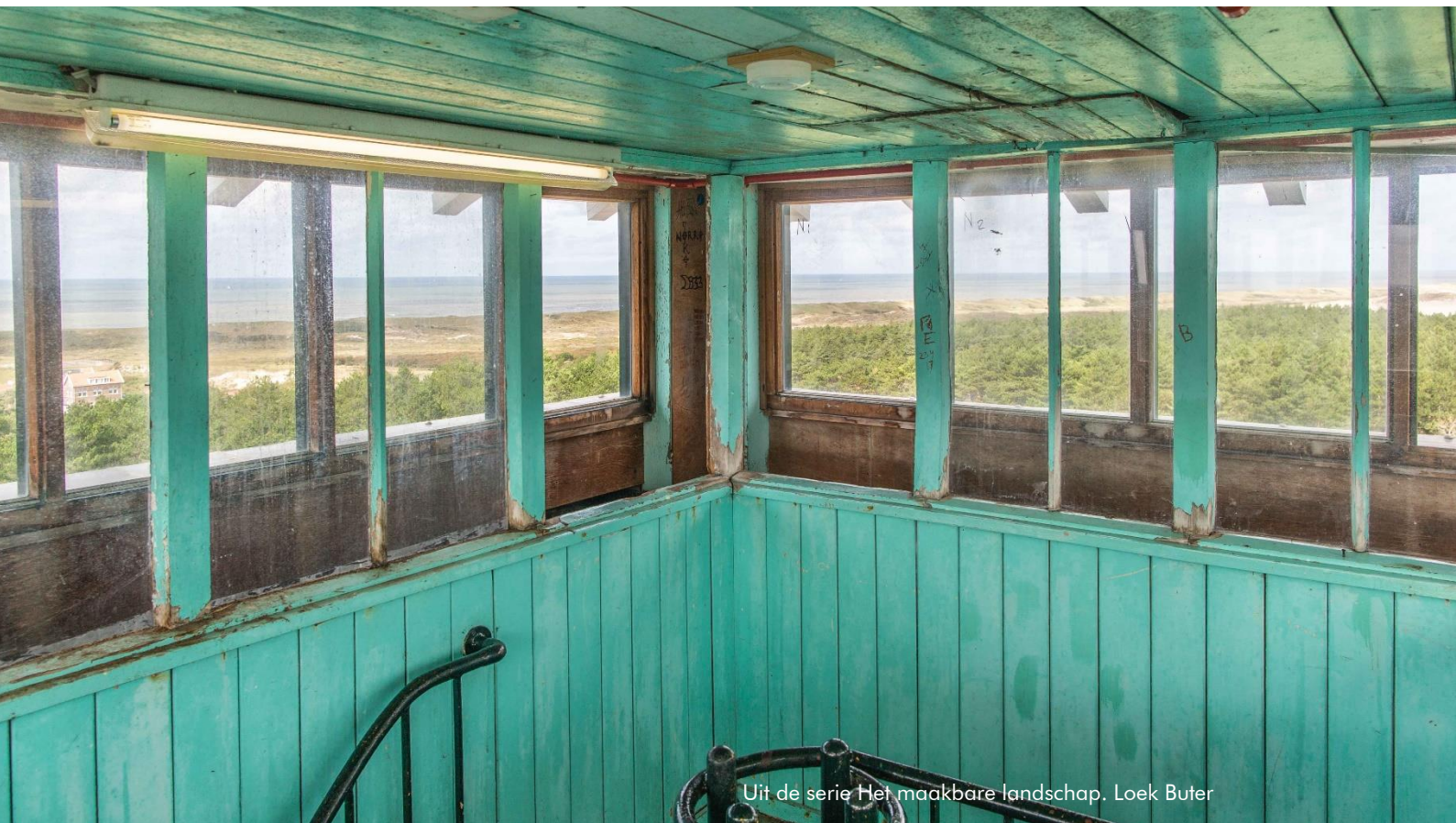
Uit de serie Het maakbare landschap. Loek Buter

De Adviescommissie Welstand Stede Broec is ook in 2022 in uw gemeente enthousiast pleitbezorger geweest voor ruimtelijke kwaliteit. De gemeenteraad heeft ons de opdracht gegeven te adviseren op basis van de gemeentelijke beleidskaders. Met dit jaarverslag legt de commissie verantwoording af aan de gemeenteraad over de onafhankelijke advisering in 2022.