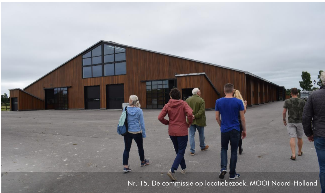
Nr. 15. De commissie op locatiebezoek. MOOI Noord-Holland