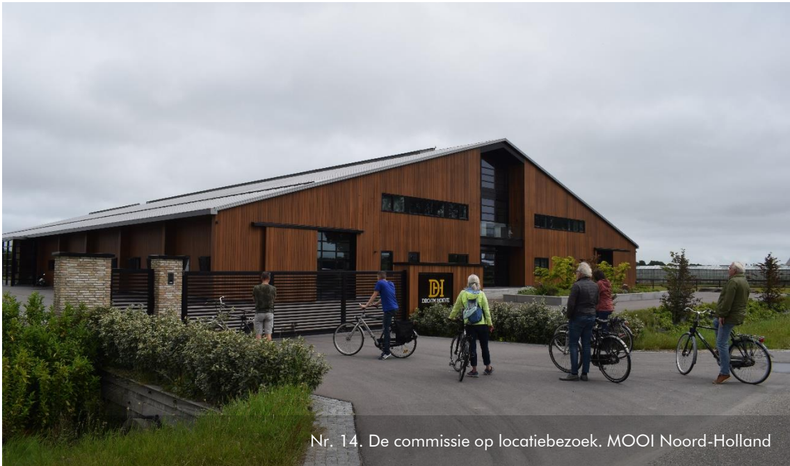
Nr. 14. De commissie op locatiebezoek. MOOI Noord-Holland