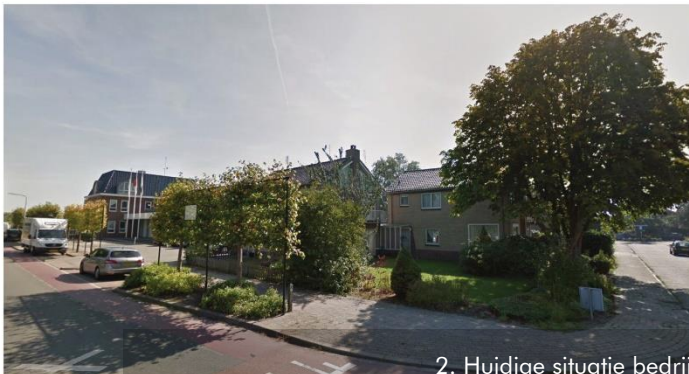
2 WONINGEN OP PLANGEBIED