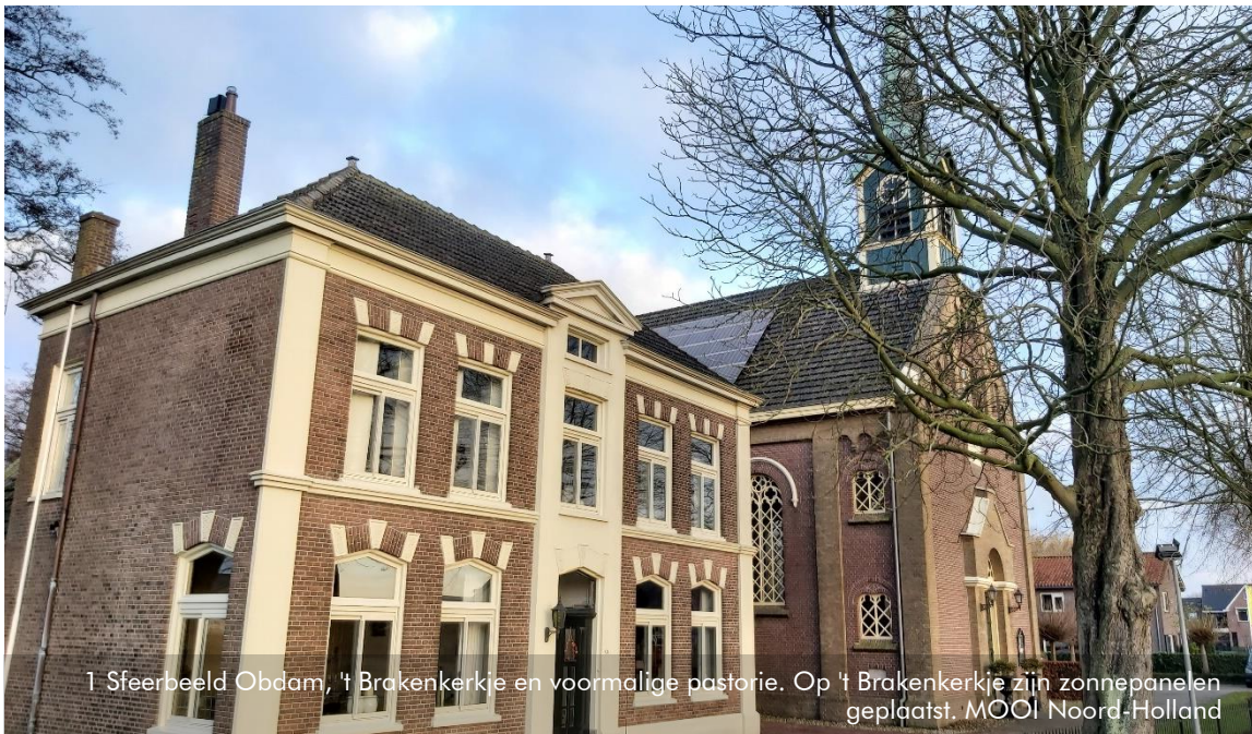
1 Sfeerbeeld Obdam, 't Brakenkerkje en voormalige pastorie. Op 't Brakenkerkje zijn zonnepanelen geplaatst.