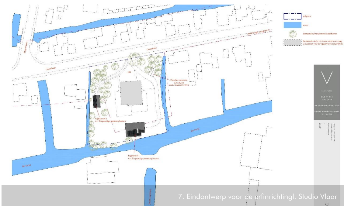
7. Eindontwerp voor de erfinrichting. Studio Vlaar