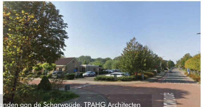
ZICHT OP PARKEERTERRAIN

2. Huidige situatie bedrijfspanden aan de Scharwoude. TPAHG Architecten