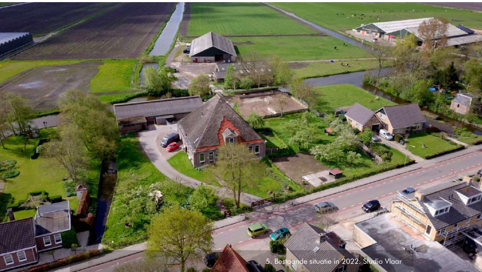
5. Bestaande situatie in 2022. Studio Vlaar