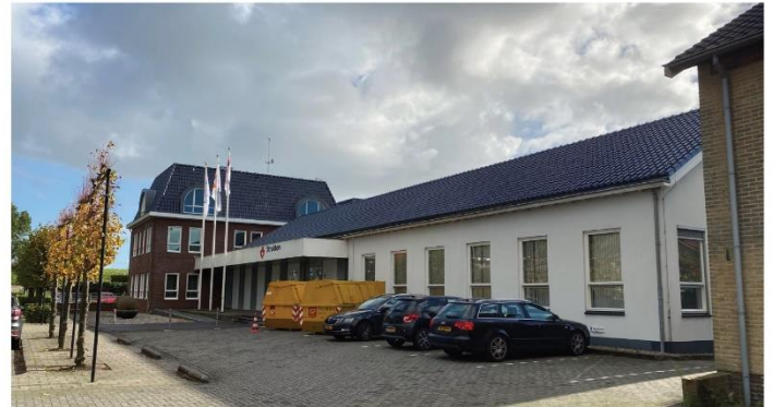
ZICHT VANAF SCHARWOUDE