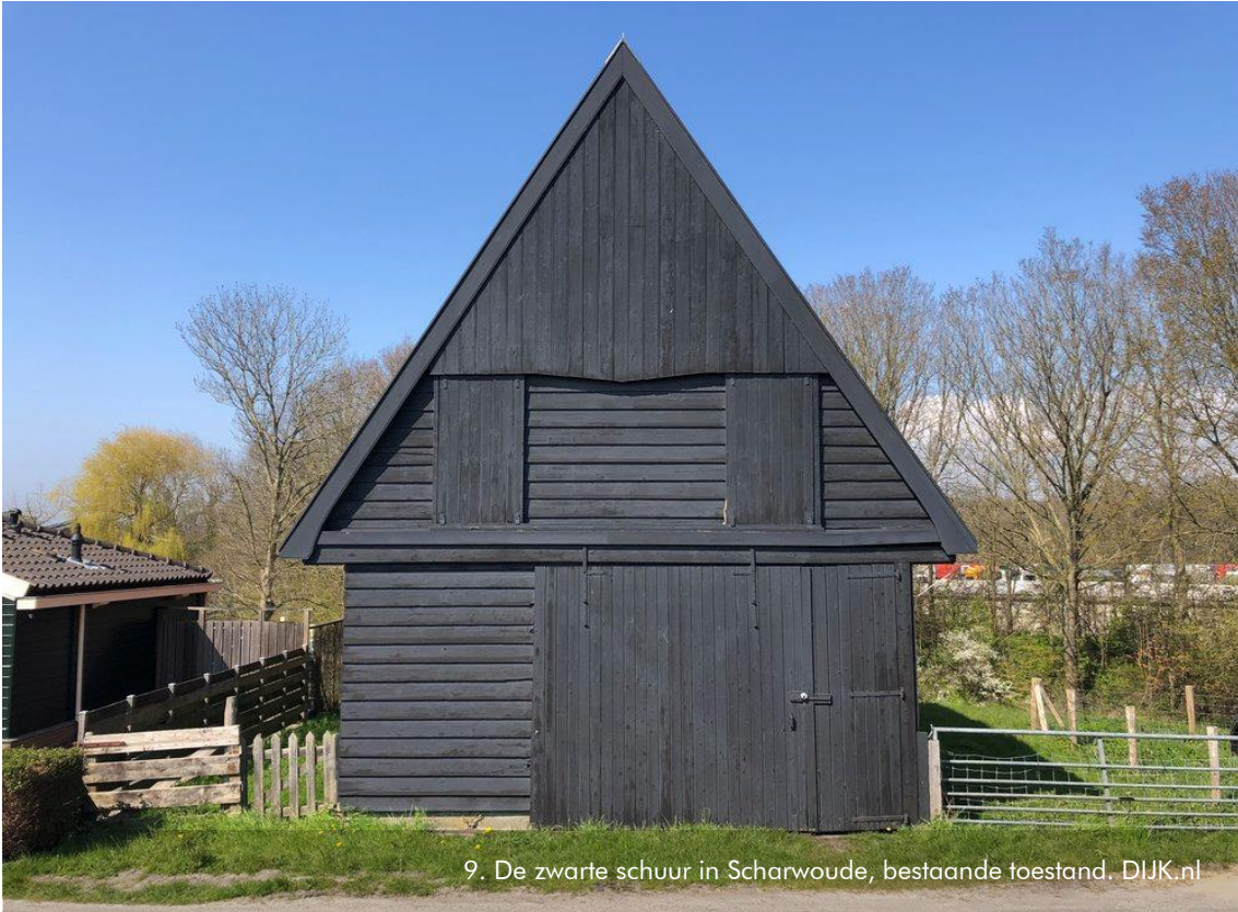
9. De zwarte schuur in Scharwoude, bestaande toestand. DIJK.nl