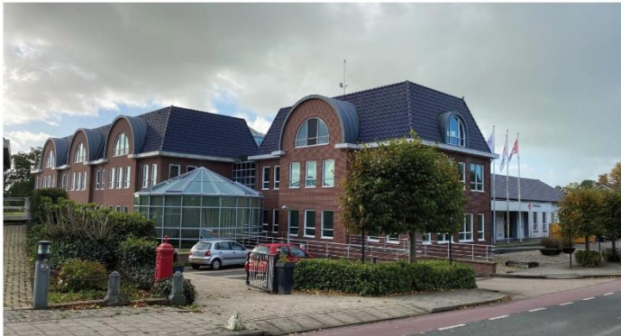
ZICHT VANAF IJSELMEERDIJK