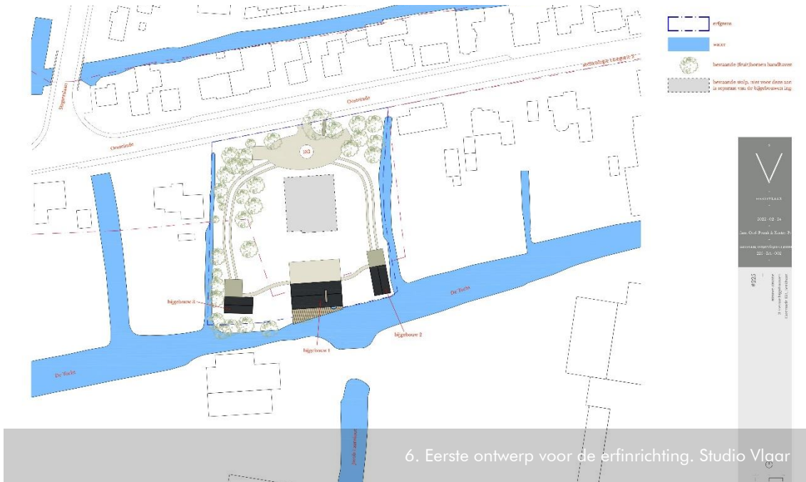
6. Eerste ontwerp voor de erfinrichting. Studio Vlaar