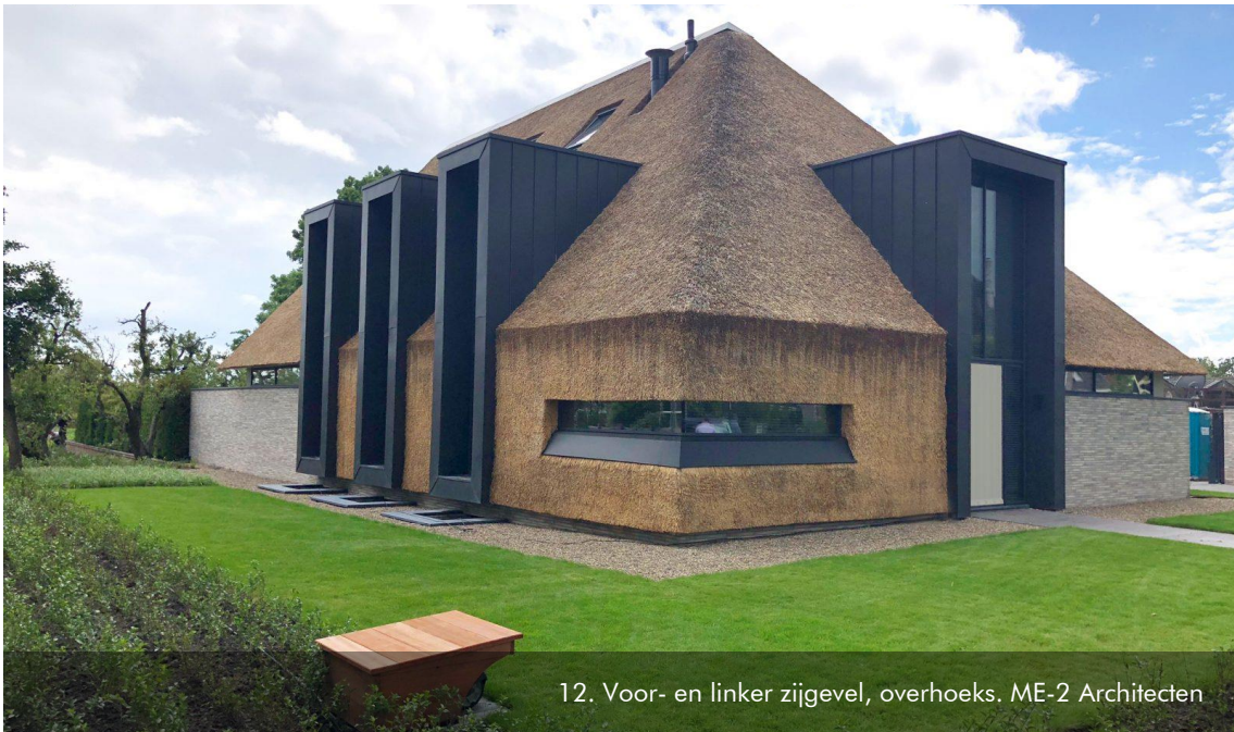
12. Voor- en linker zijgevel, overhoeks. ME-2 Architecten