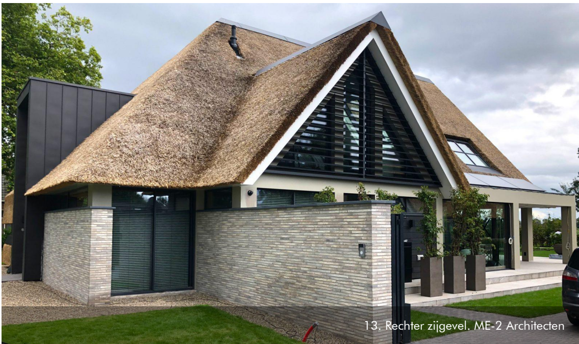
13. Rechter zijgevel. ME-2 Architecten