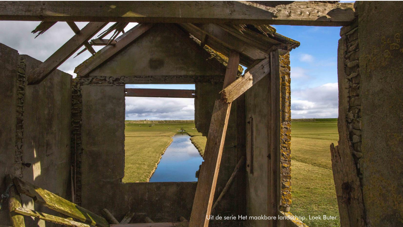
Uit de serie Het maakbare landschap. Loek Buter