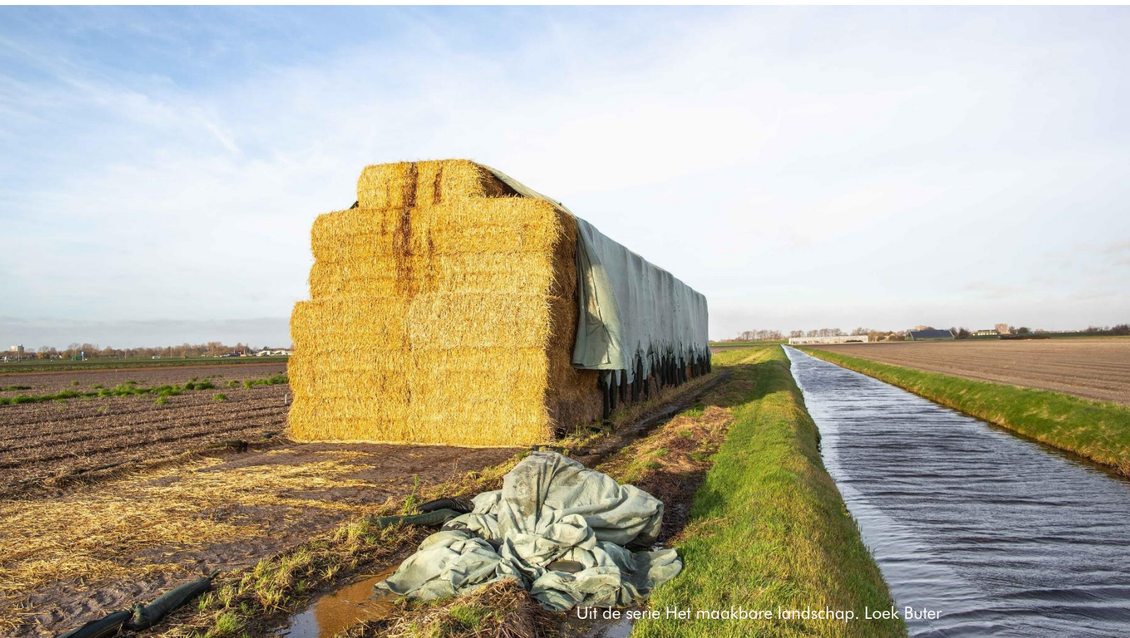
Uit de serie Het maakbare landschap. Loek Buter