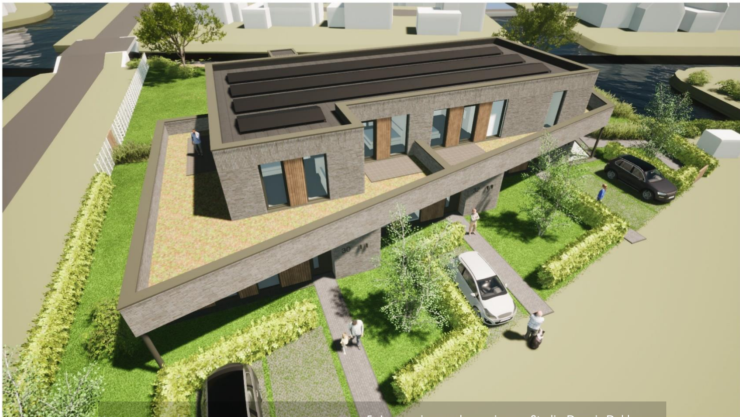
5. Impressie van de woningen. Studio Dennis Dekker.