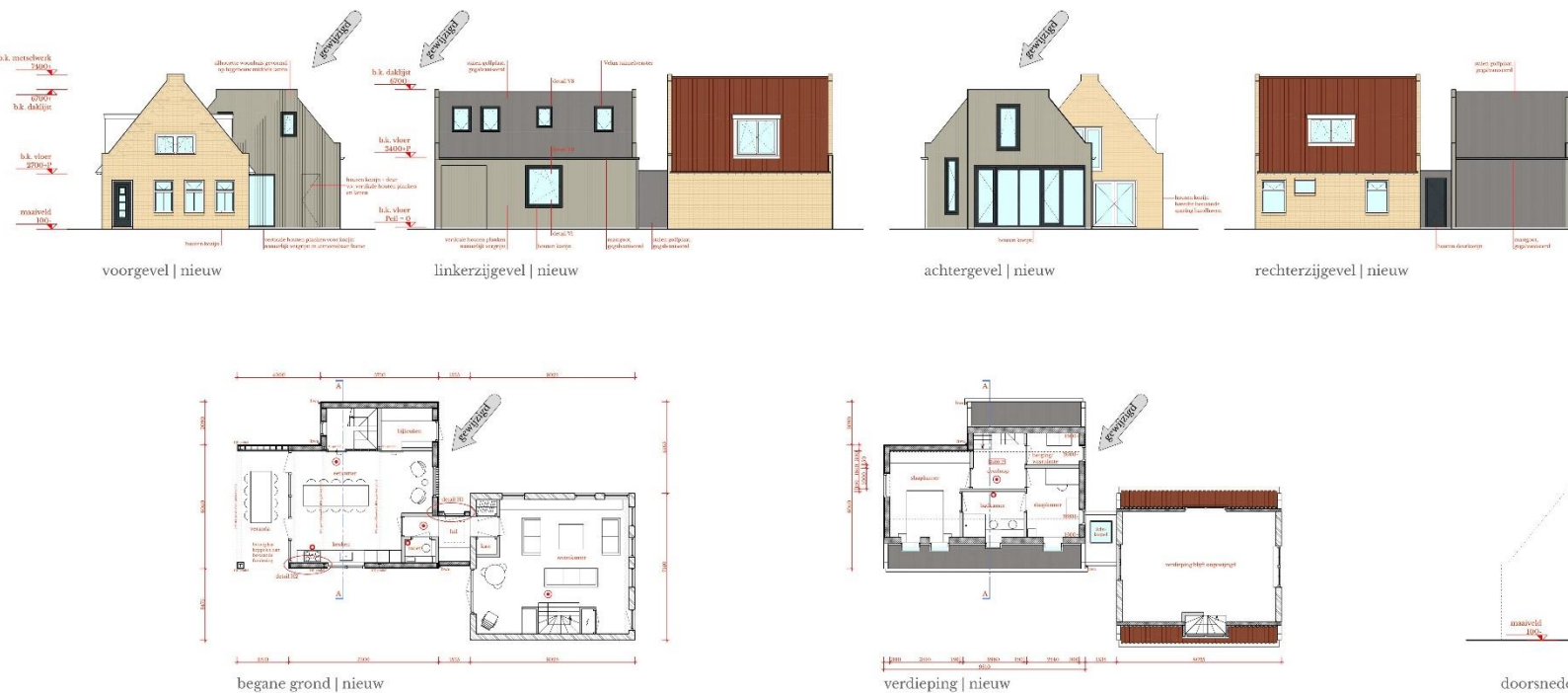
8. Eindontwerp van de uitbreiding. Studio Vlaar.