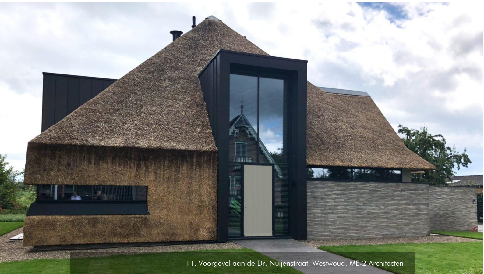
11. Voorgevel aan de Dr. Nuijenstraat, Westwoud. ME-2 Architecten