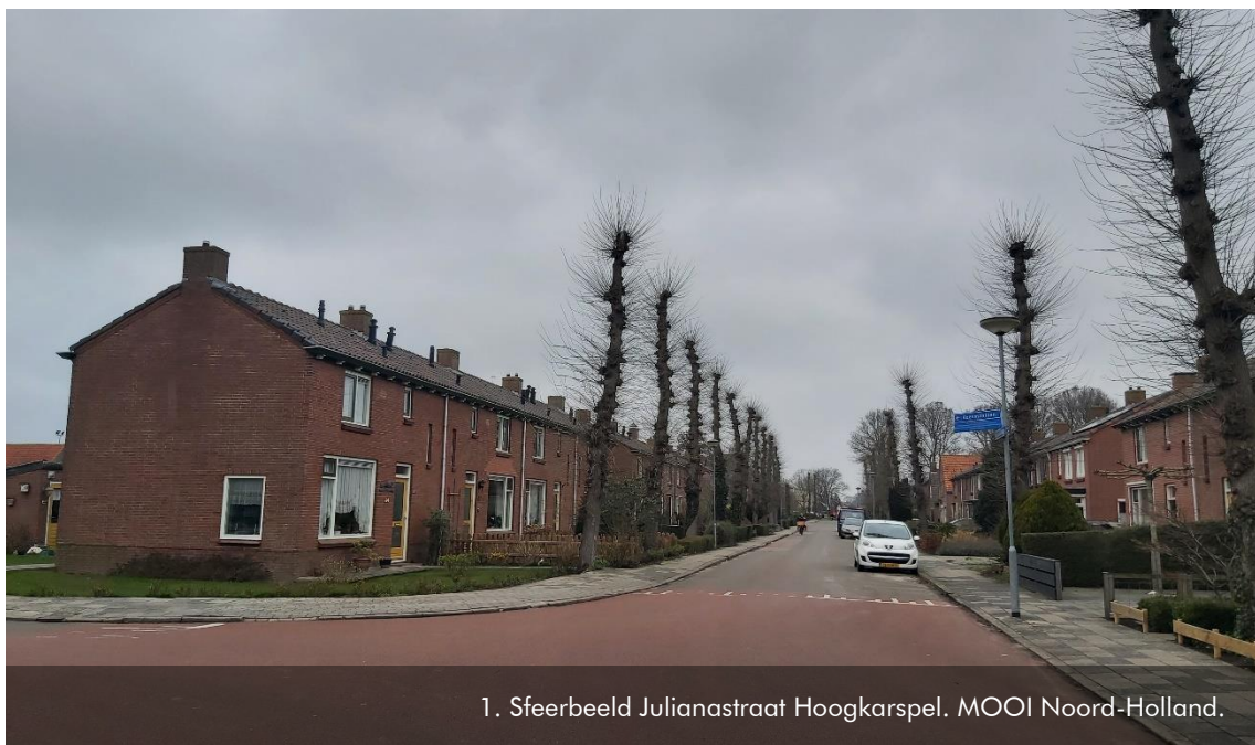
1. Sfeerbeeld Julianastraat Hoogkarspel. MOOI Noord-Holland.

Voorzitter Adviescommissie Ruimtelijke Kwaliteit Drechterland