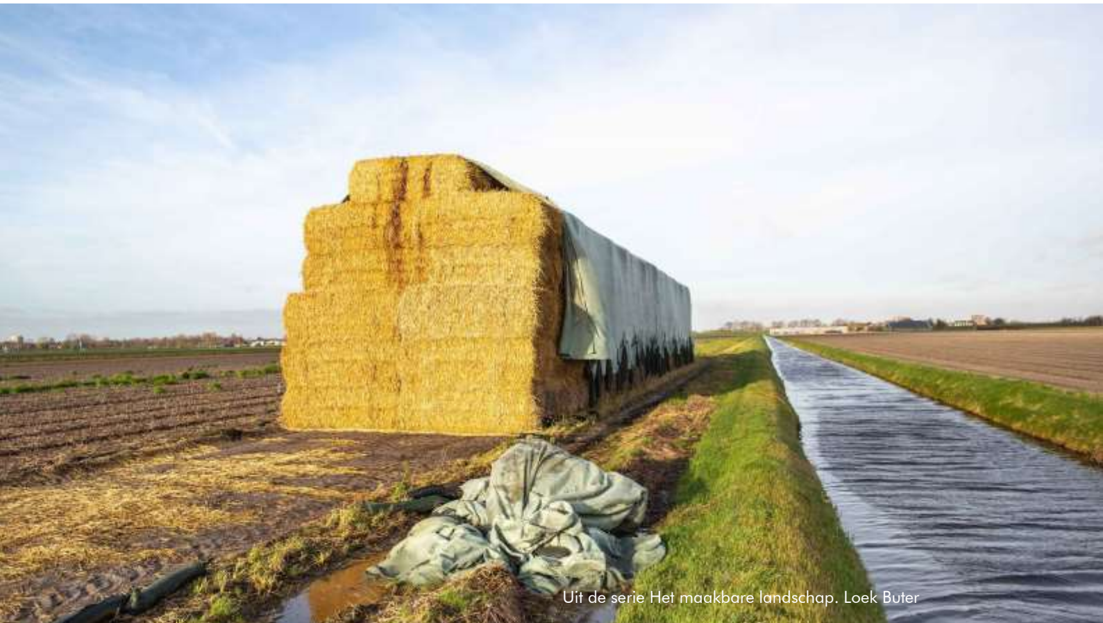
Uit de serie Het maakbare landschap. Loek Buter