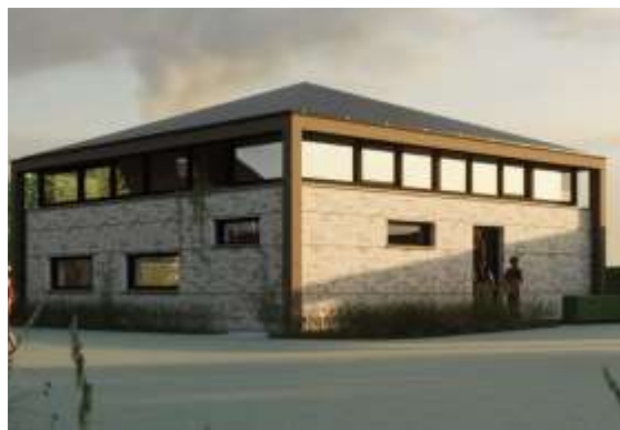
9. Hooisuur: oorspronkelijke en gewijzigde ontwerp, ENZO Architectuur en Interieur