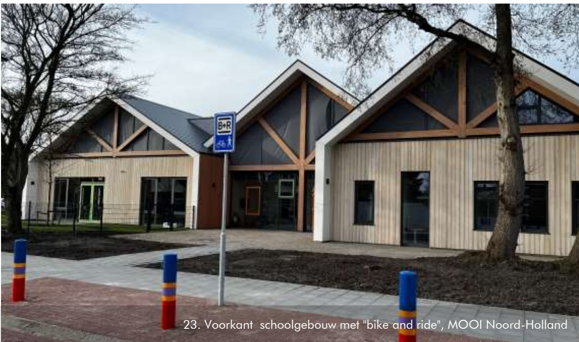
23. Voorkant schoolgebouw met "bike and ride", MOOI Noord-Holland