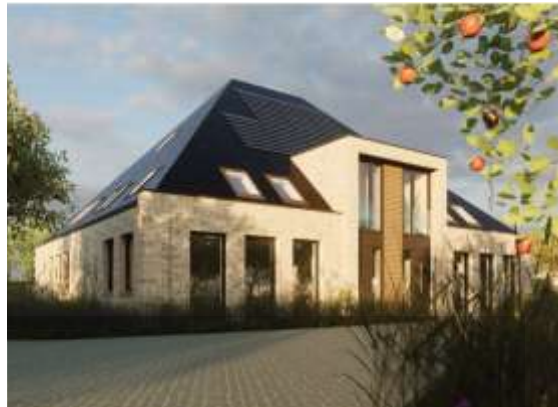
8. Stolp: oorspronkelijke en gewijzigde ontwerp, ENZO Architectuur en Interieur