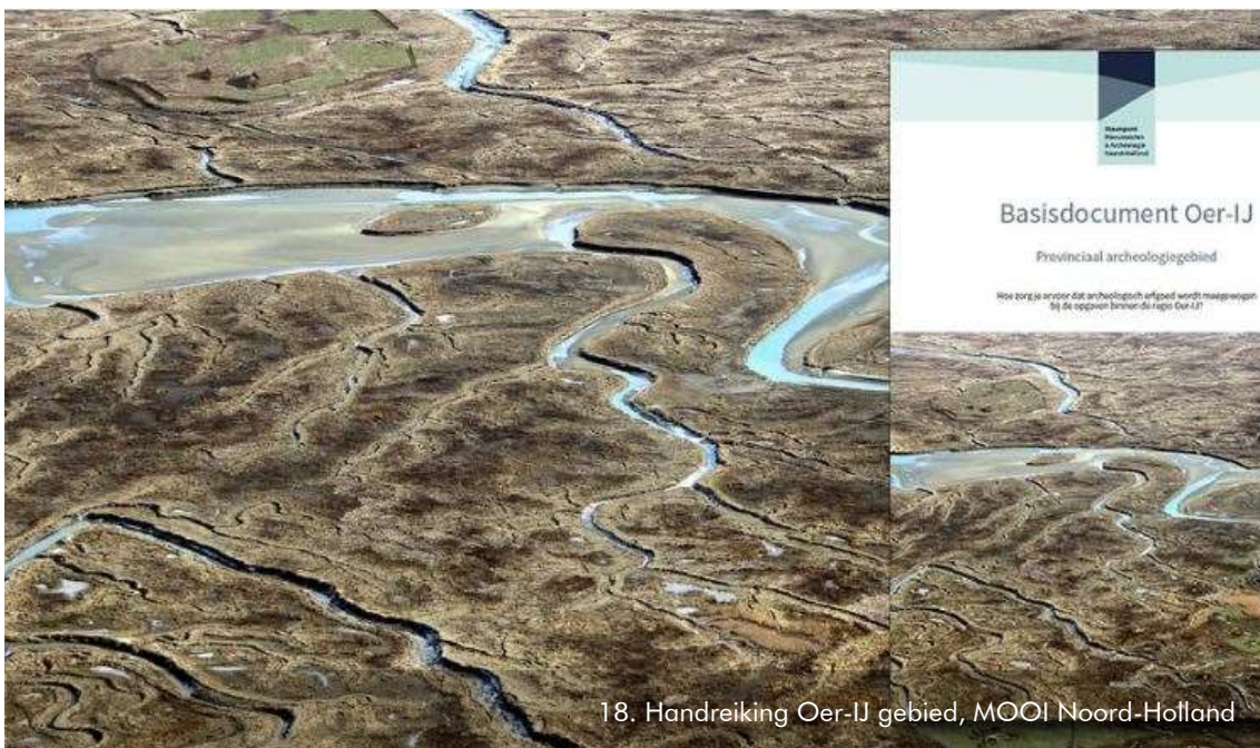
18. Handreiking Oer-IJ gebied, MOOI Noord-Holland