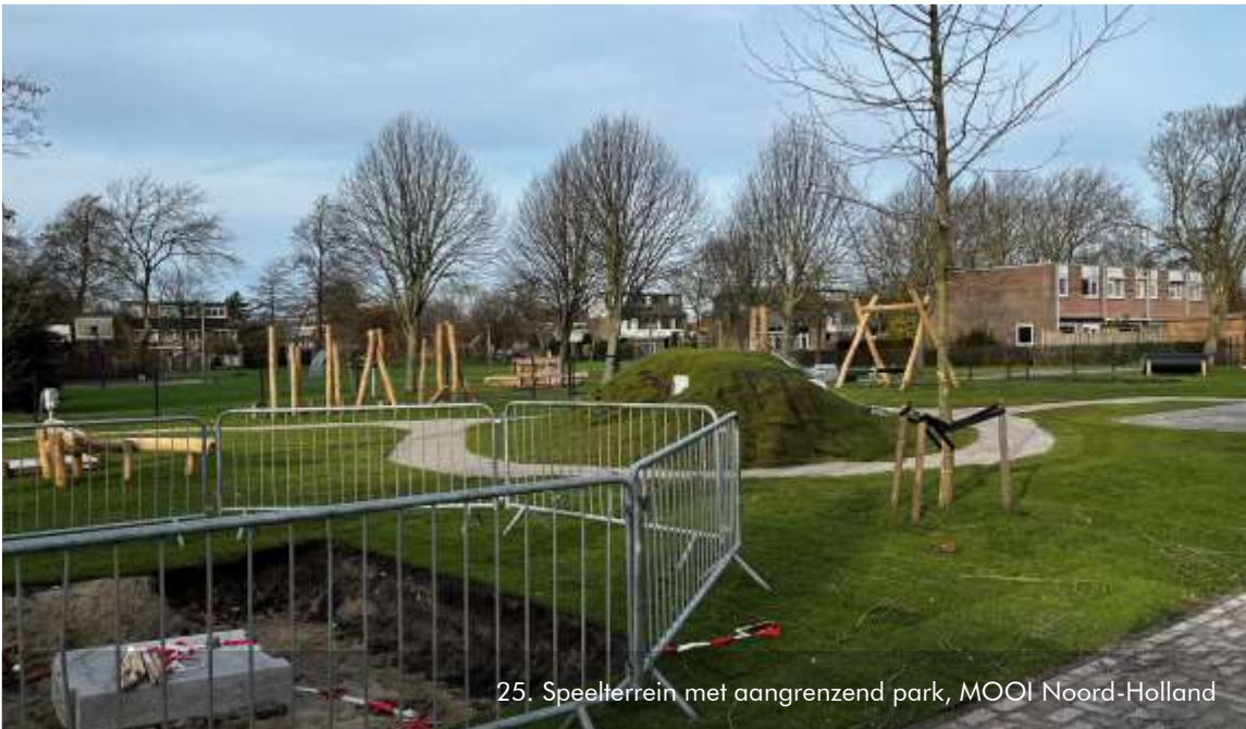
25. Speelterrein met aangrenzend park, MOOI Noord-Holland