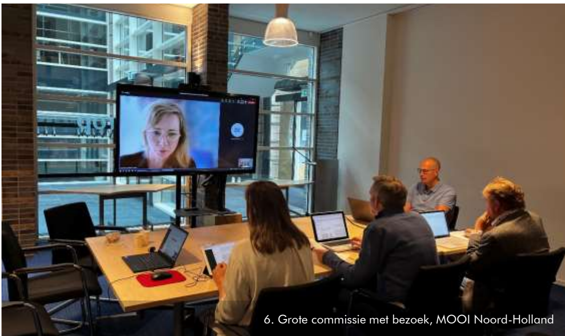
6. Grote commissie met bezoek, MOOI Noord-Holland

Er zijn meerdere gemeentelijke beoordelingskaders waar de commissie rekening mee houdt. De welstandsnota vastgesteld in 2011 door de gemeenteraad, is het belangrijkste. Via de link kunt u de welstandsnota voor uw gemeente inzien. Naast de welstandsnota heeft de gemeente ook een document over het reclamebeleid dat in 2012 is vastgesteld. In veel gevallen is ook het bestemmingsplan en ander ruimtelijke ordeningsbeleid voor de commissie relevant.