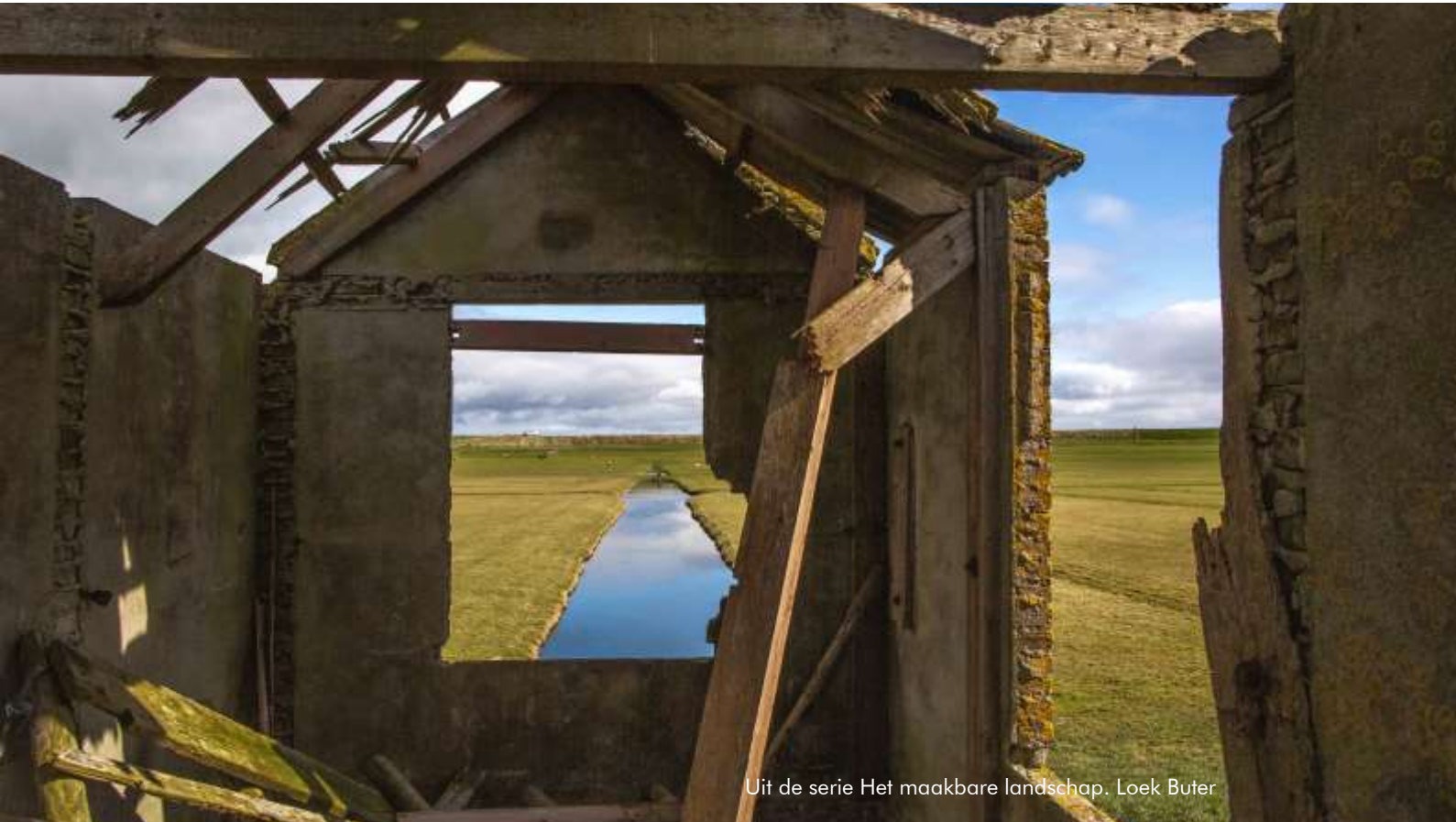
Uit de serie Het maakbare landschap. Loek Buter