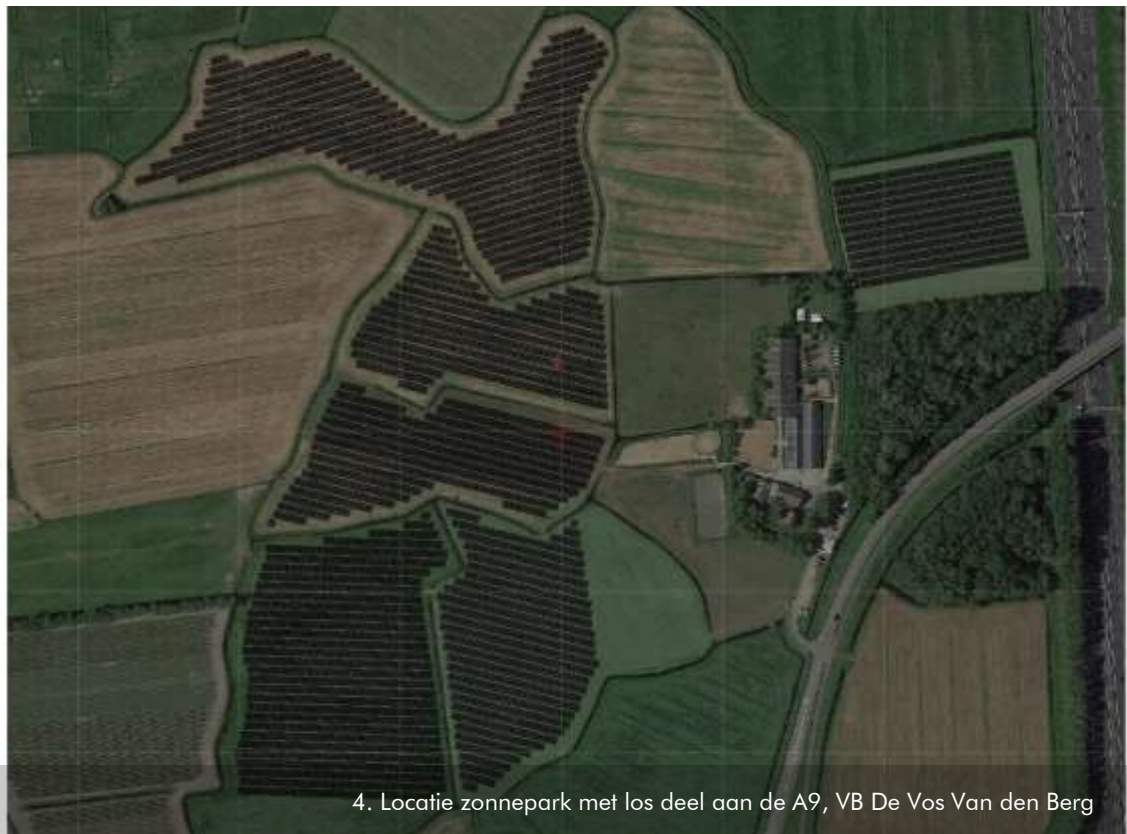
4. Locatie zonnepark met los deel aan de A9, VB De Vos Van den Berg