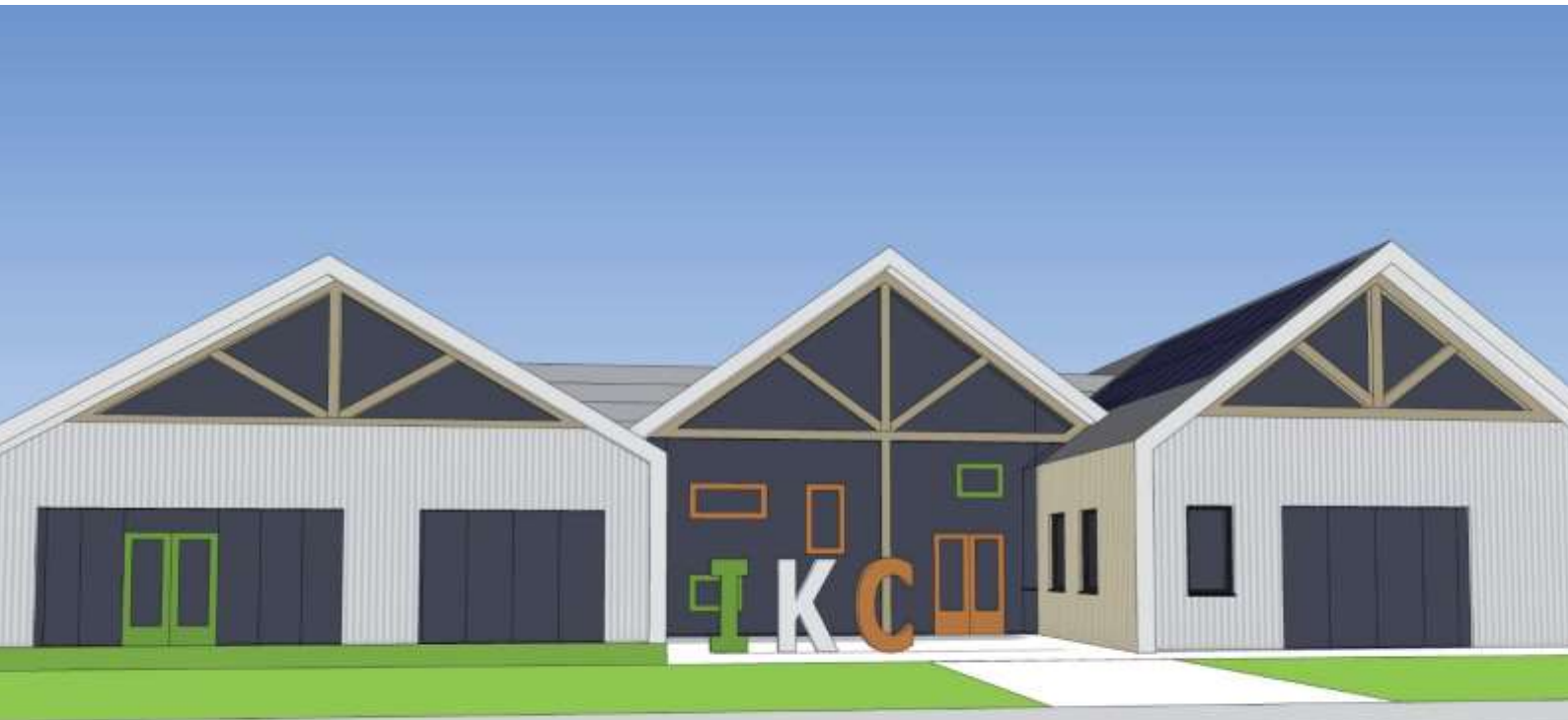
19. Schetsontwerp impressie voorkant, Weedaarchitecten