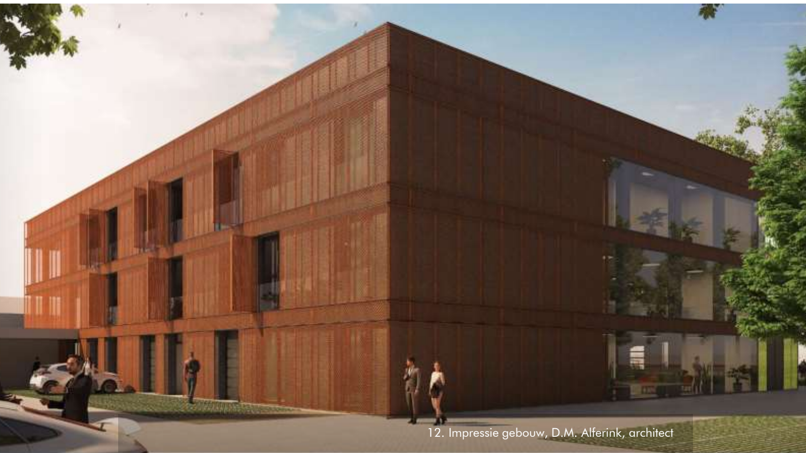
12. Impressie gebouw, D.M. Alferink, architect