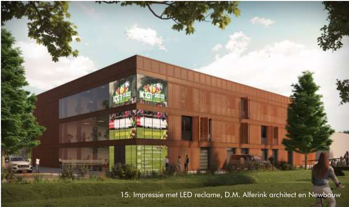
15. Impressie met LED reclame, D.M. Alferink architect en Newbouw