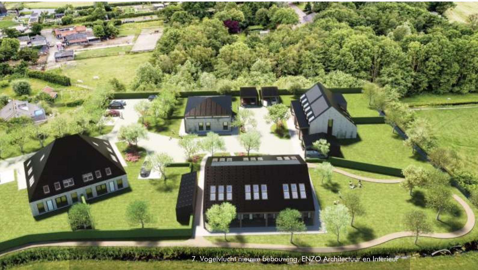
7. Vogelvucht nieuwe bebouwing, ENZO Architectuur en Interieur