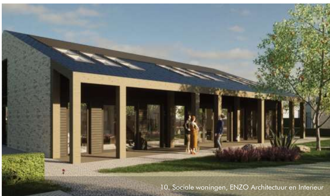
10. Sociale woningen, ENZO Architectuur en Interieur