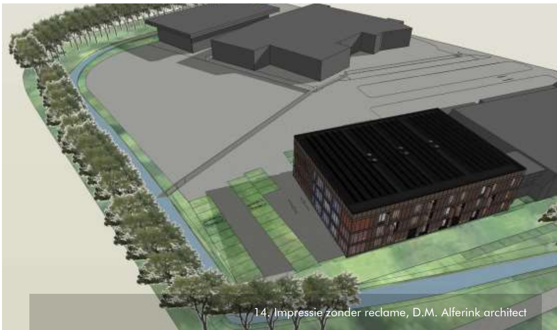
14. Impressie zonder reclame, D.M. Alferink architect