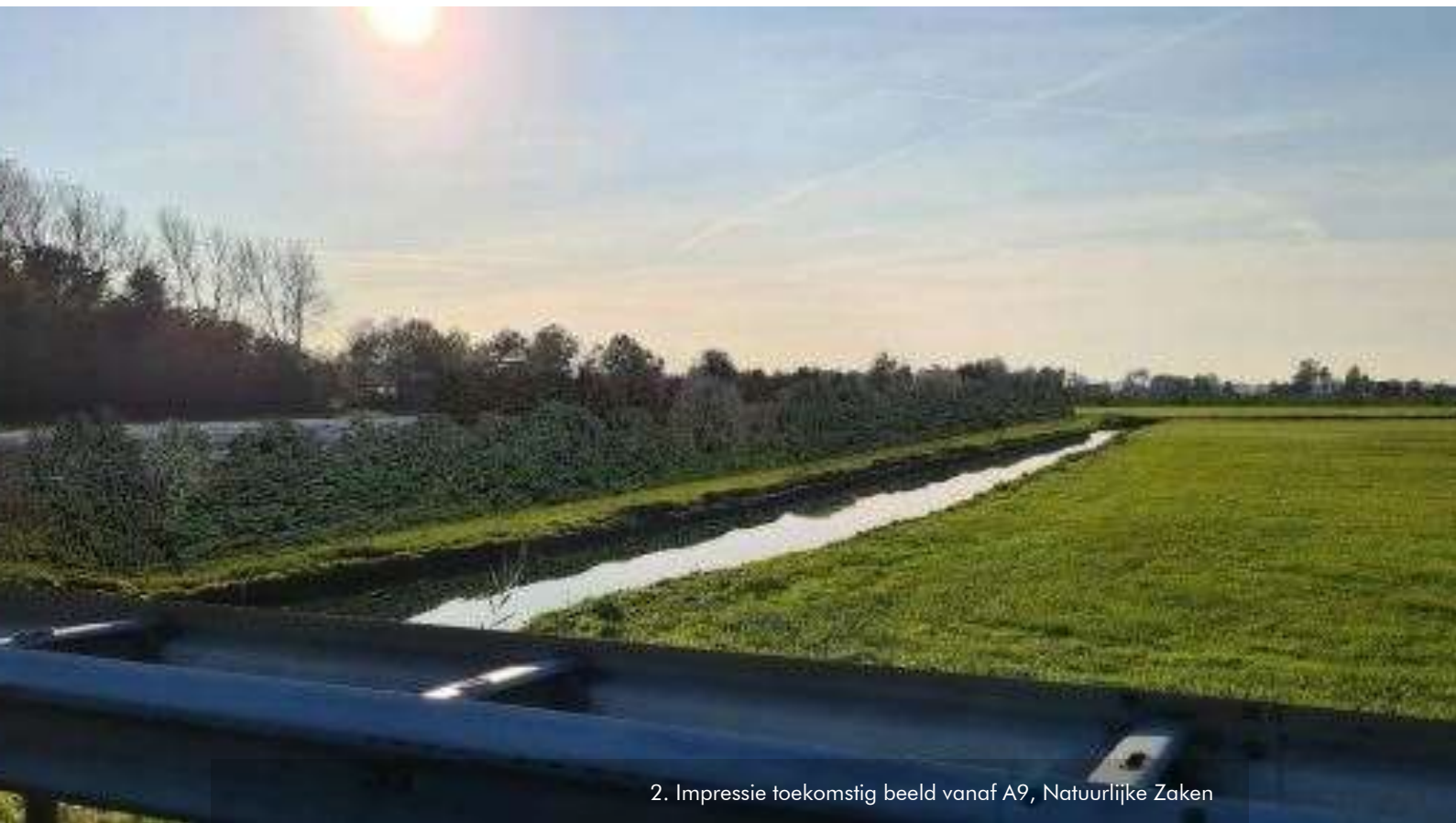
2. Impressie toekomstig beeld vanaf A9, Natuurlijke Zaken