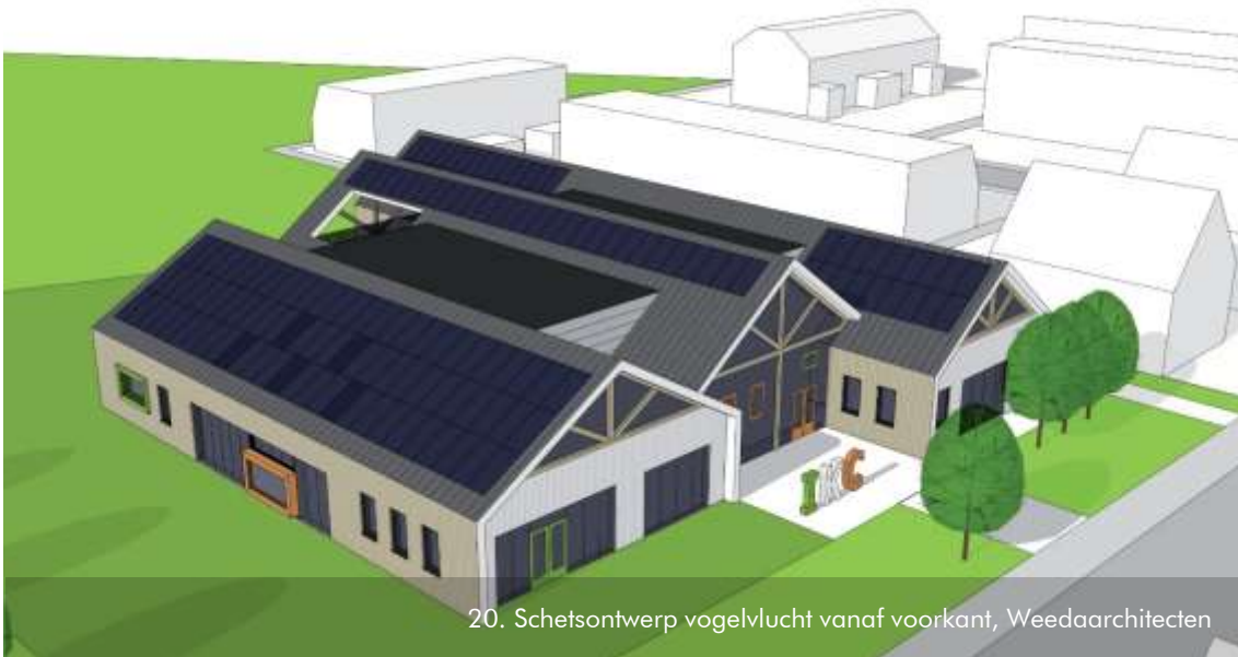
20. Schetsontwerp vogelvlucht vanaf voorkant, Weedaarchitecten