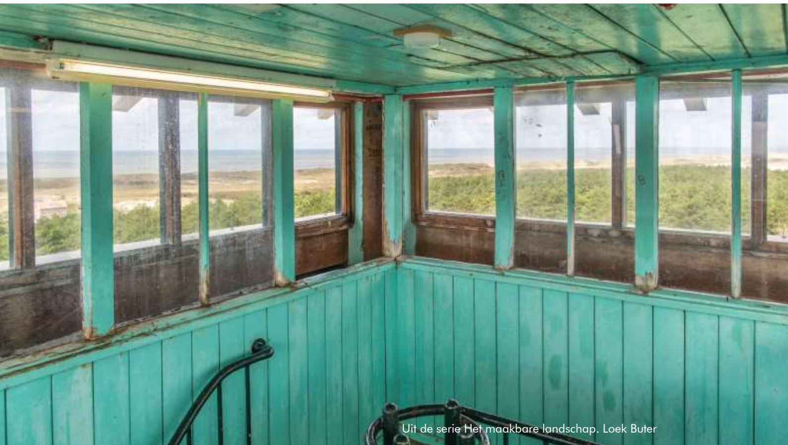
Uit de serie Het maakbare landschap. Loek Buter

De Welstandscommissie Uitgeest is ook in 2022 in uw gemeente enthousiast pleitbezorger geweest voor ruimtelijke kwaliteit. De gemeenteraad heeft ons de opdracht gegeven te adviseren op basis van de gemeentelijke beleidskaders. Met dit jaarverslag legt de commissie verantwoording af aan de gemeenteraad over de onafhankelijke advisering in 2022.