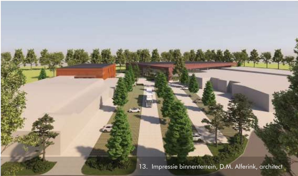
13. Impressie binnenterrein, D.M. Alferink, architect

in de gemeentelijke reclamenota. De commissie vindt het ook geen toevoeging aan de architectuur. Een kleinere, in de architectuur geïntegreerde, niet verlichte uiting zou volgens haar nog wel mogelijk zijn. In een aangepaste aanvraag is de LED reclame uiting verwijderd. In plaats daarvan heeft de architect ter plekke van de bovenste laag aan de linkerkant van de noordgevel een kader opgenomen voor een toekomstige reclame uiting.