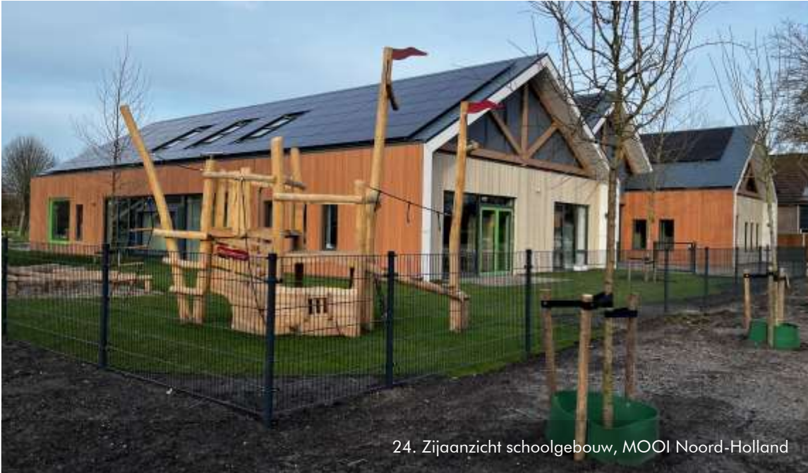
24. Zijaanzicht schoolgebouw, MOOI Noord-Holland