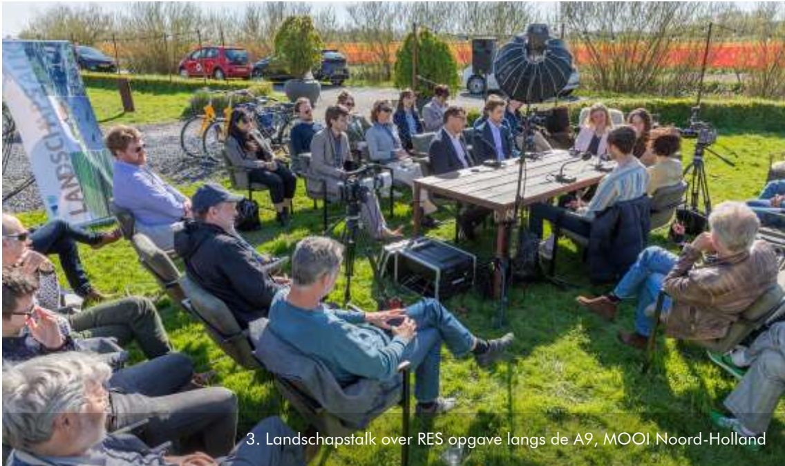
3. Landschapstak over RES opgave langs de A9, MOOI Noord-Holland

overhoek. Een gemiste kans is ook het niet laten aansluiten van oever en haag. Het park blijkt echter niet rendabel te zijn zonder het apart liggend deel. De Welstandscommissie gaat akkoord met de (tijdelijke) aanvraag, maar betreurt het dat het niet één geheel is geworden. Het is intussen onbekend of het deel langs de A9 doorgaat.