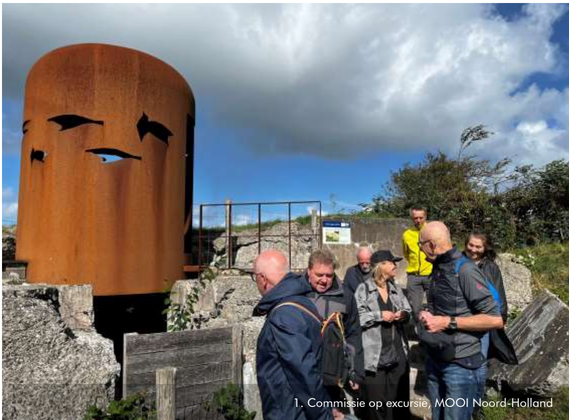
1. Commissie op excursie, MOOI Noord-Holland