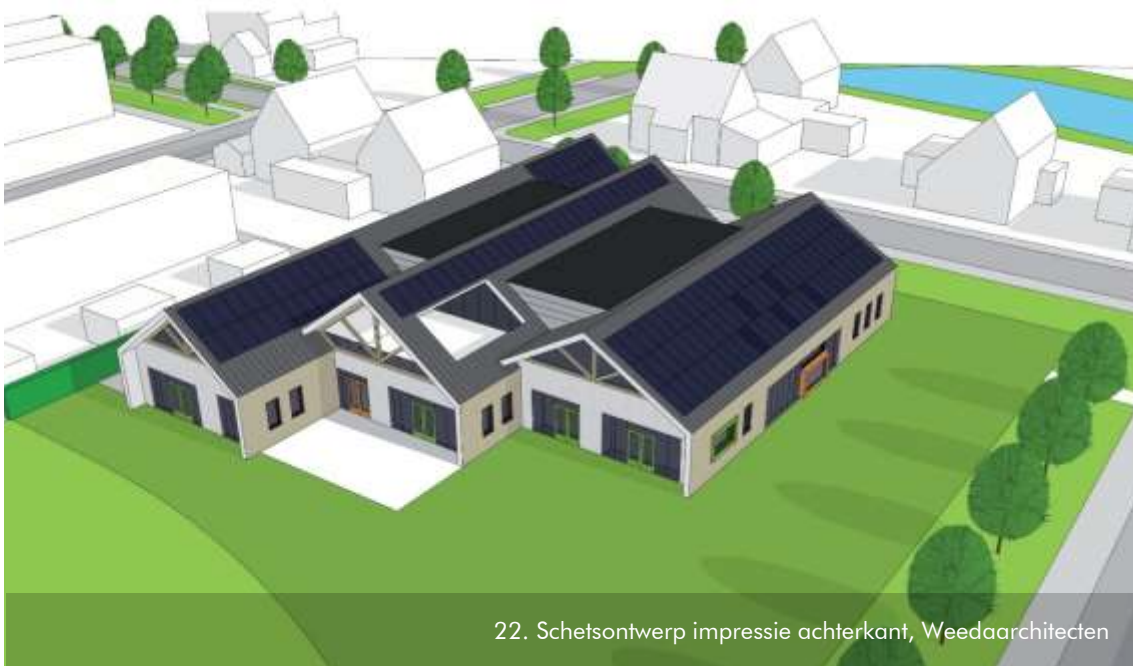
22. Schetsontwerp impressie achterkant, Weedaarchitecten