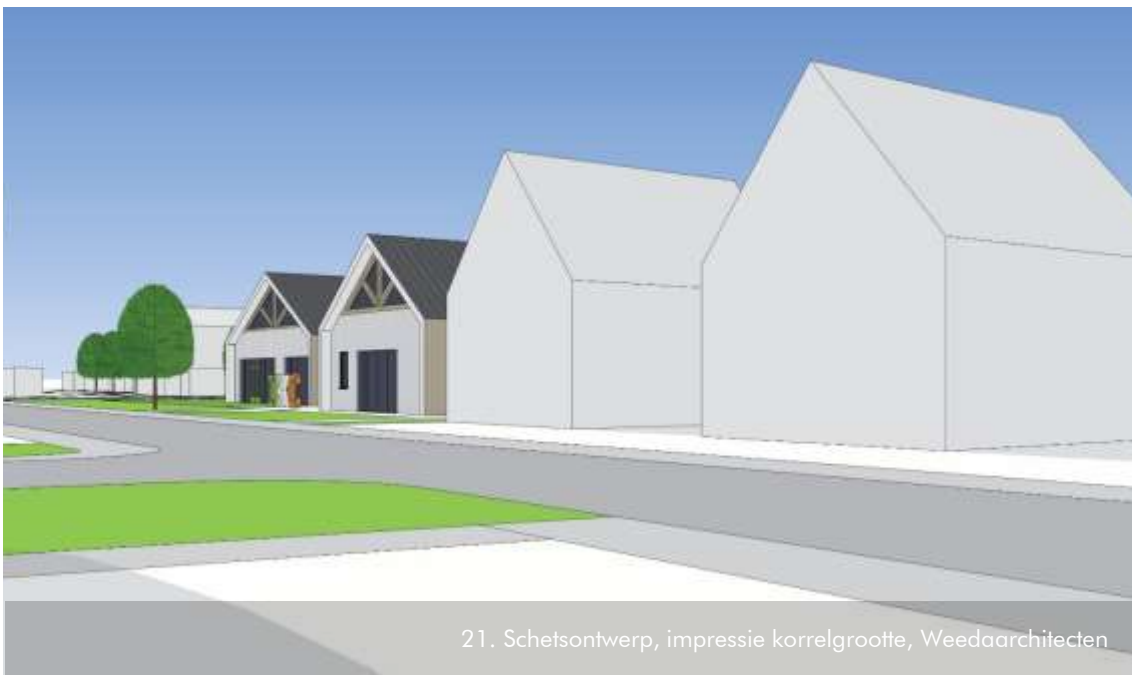
21. Schetsontwerp, impressie korrelgrootte, Weedaarchitecten