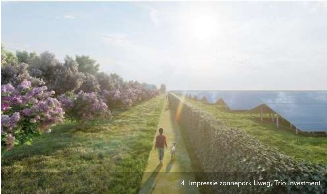
4. Impressie zonnepark IJweg, Trio Investment

juicht de ontwikkelingen toe. Ze krijgt bevrogen aanvragers in de vergadering, die vertellen dat ze jammer genoeg in hun ambities tegengehouden worden door de omwonenden, die onder anderen bang zijn voor ongewenste activiteiten in de zonneparken.