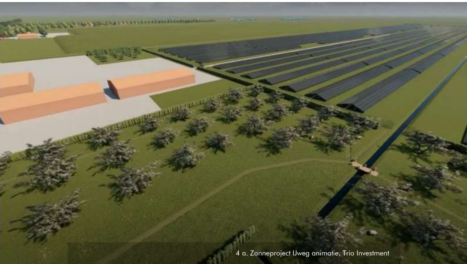
4 a. Zonneproject IJweg animatie, Trio Investment