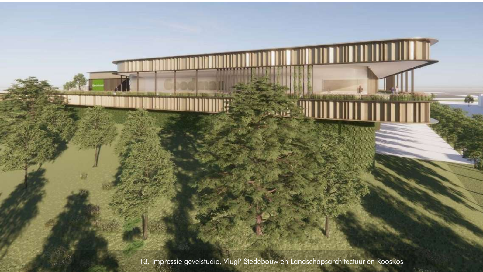
13. Impressie gevelstudie, VlugP Stedebouw en Landschapsarchitectuur en RoosRos