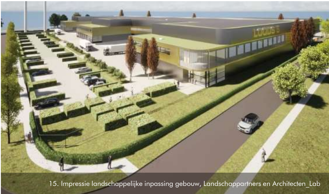
15. Impressie landschappelijke inpassing gebouw, Landschappartners en Architecten_Lab