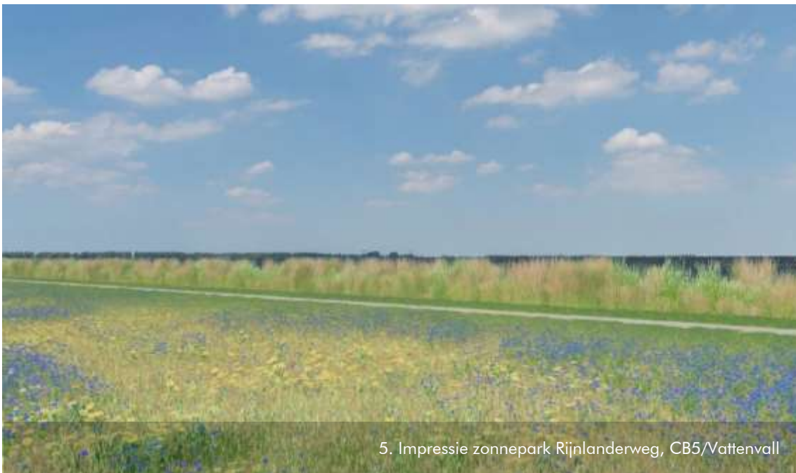
5. Impressie zonnepark Rijnlanderweg, CB5/Vattenvall