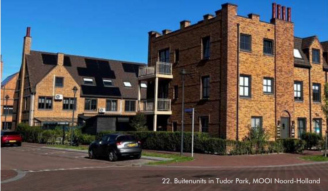
22. Buitenunits in Tudor Park, MOOI Noord-Holland