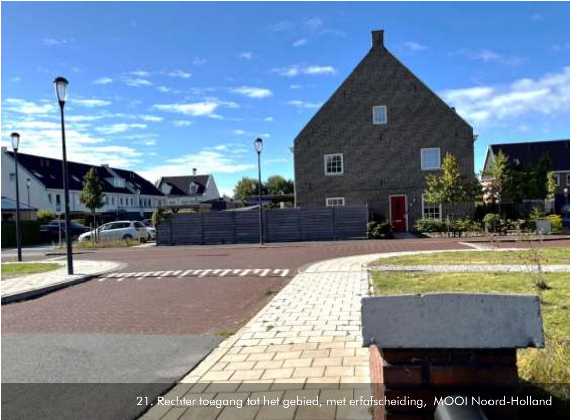
21. Rechter toegang tot het gebied, met erfafscheiding, MOOI Noord-Holland