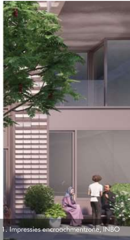
11. Impressies encroachmentzone, INBO