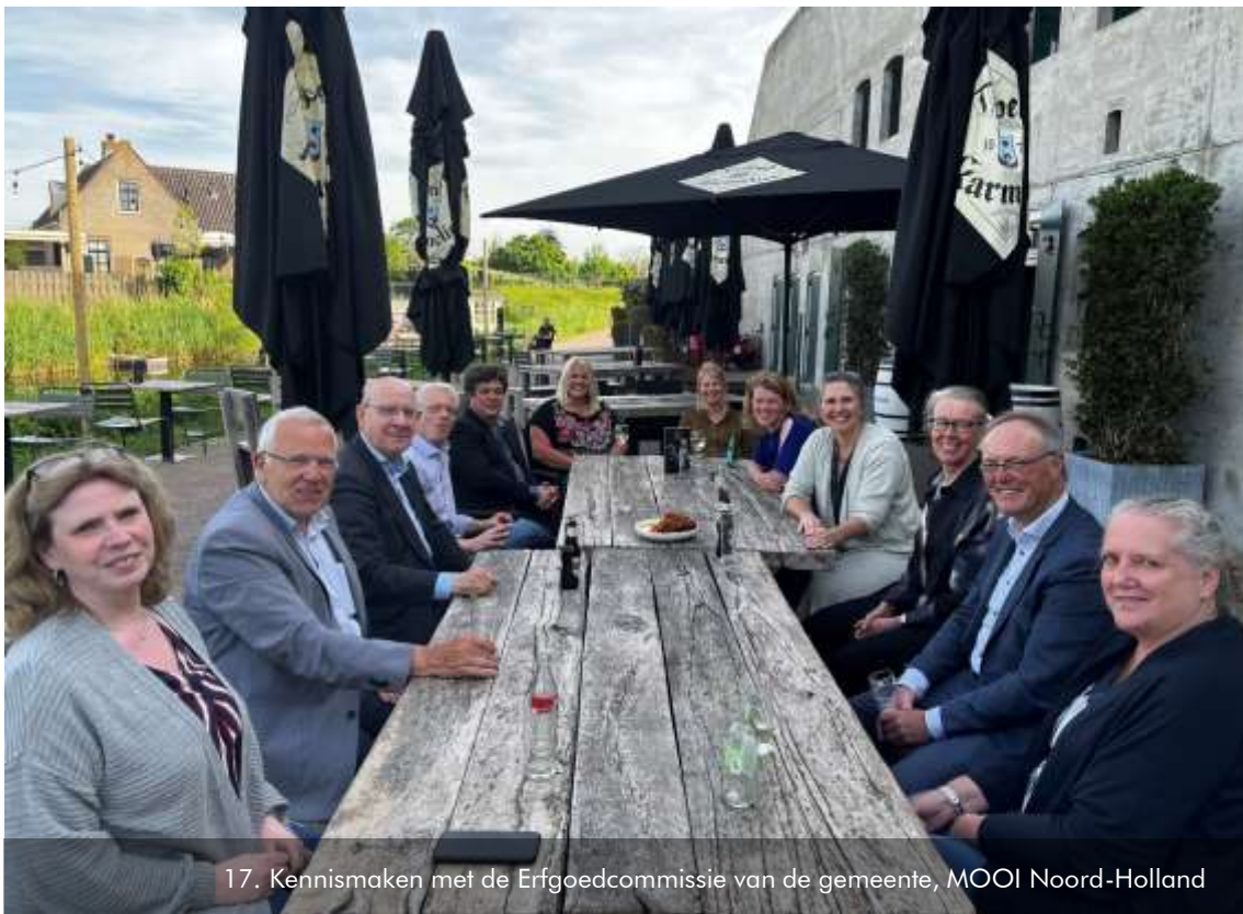
17. Kennismaken met de Erfgoedcommissie van de gemeente, MOOI Noord-Holland

Gemeentelijke ambtenaren zijn bijvoorbeeld aanwezig geweest bij bijeenkomsten over Erfgoed en participatie, Wetgeving en jurisprudentie en bij de zomerexcursie Amstelscheg .