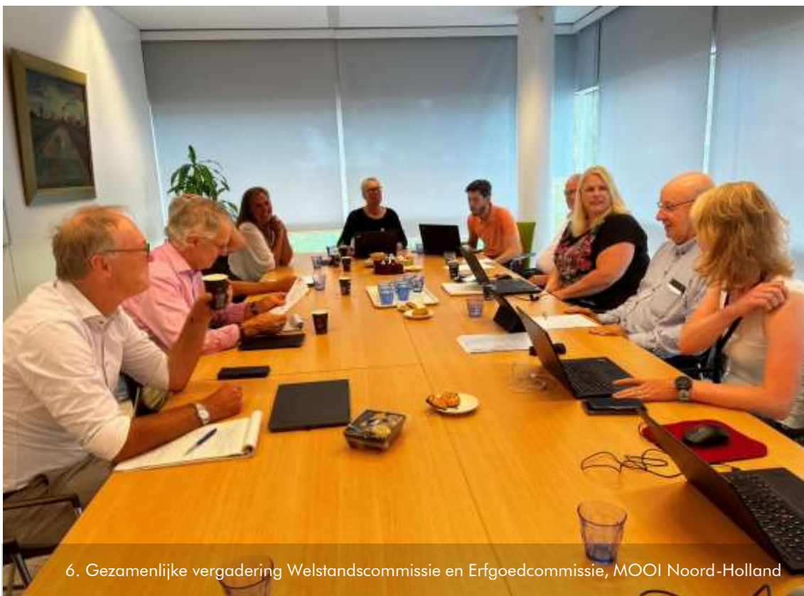
6. Gezamenlijke vergadering Welstandscommissie en Erfgoedcommissie, MOOI Noord-Holland

Na afloop van de welstandsvergadering vergadert de Welstandscommissie elke twee weken samen met de Erfgoedcommissie van de gemeente. Dit is gedaan om voor een meer efficiënte planbehandeling te zorgen.