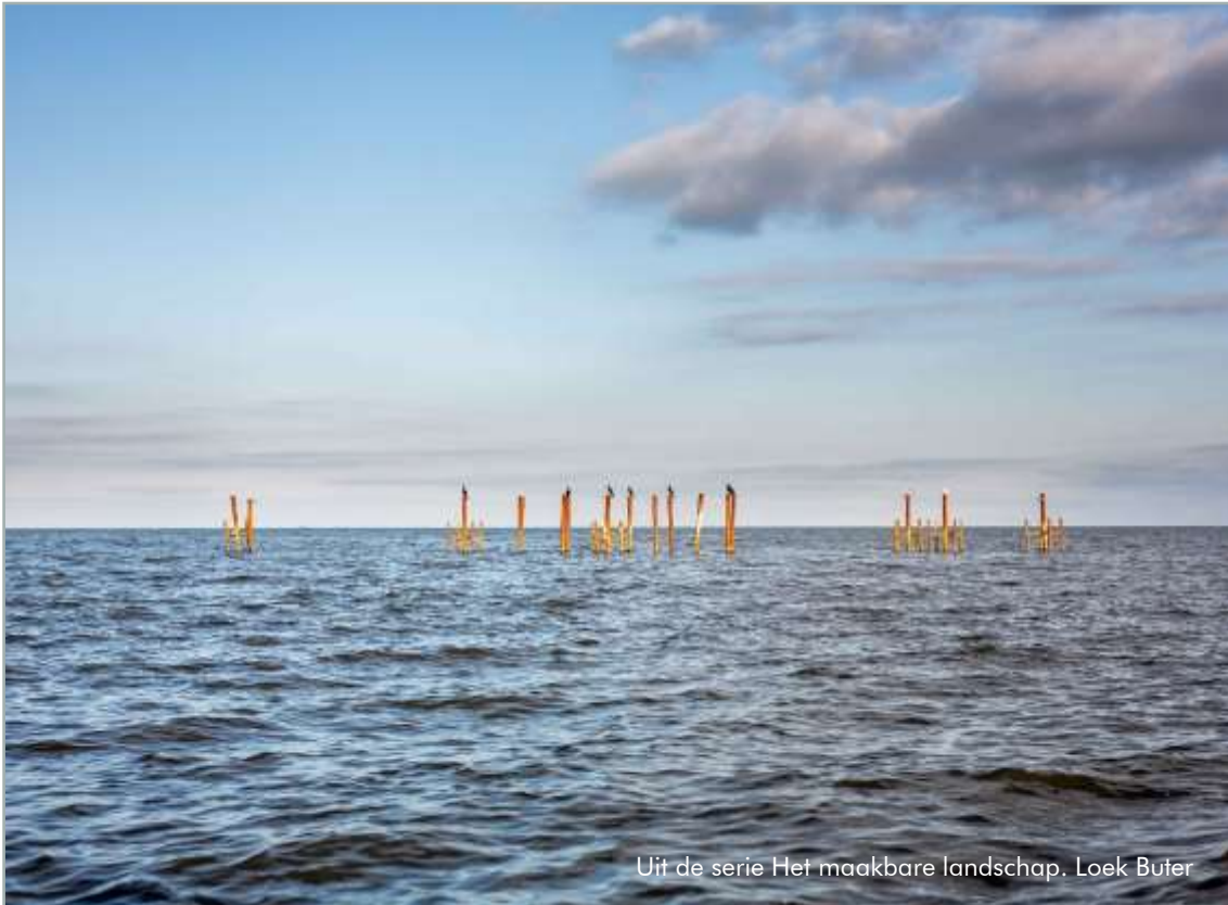
Uit de serie Het maakbare landschap. Loek Buter