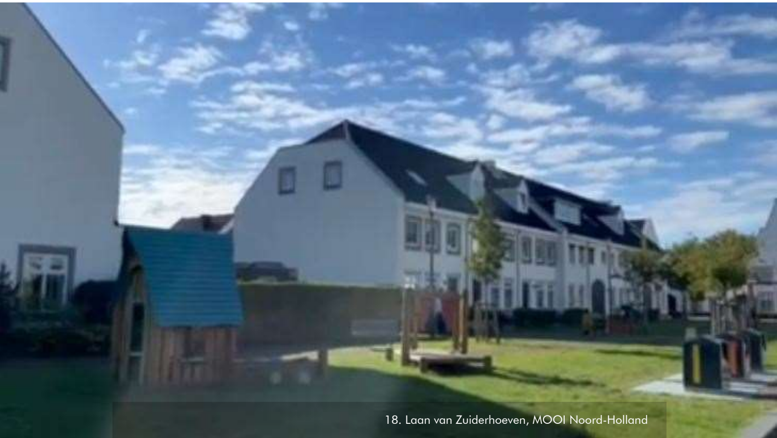
18. Laan van Zuiderhoeven, MOOI Noord-Holland