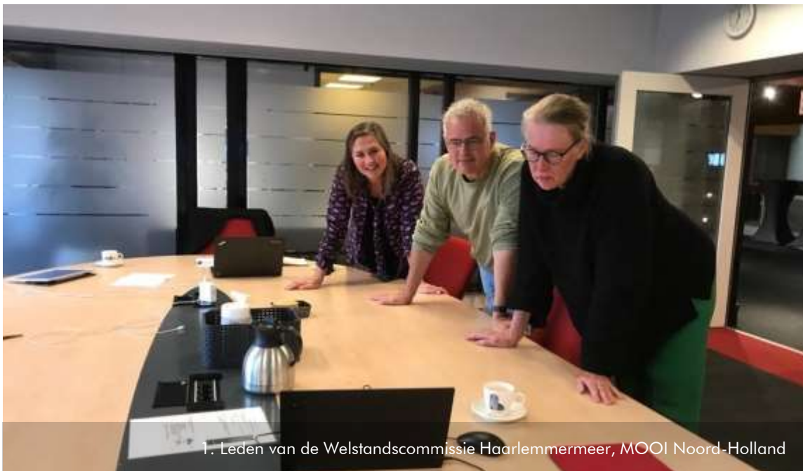
1. Leden van de Welstandscommissie Haarlemmermeer, MOOI Noord-Holland

voorzitter Welstandscommissie Haarlemmermeer