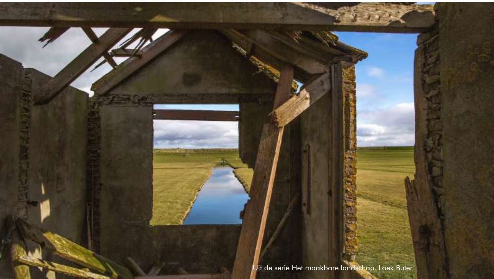
Uit de serie Het maakbare landschap. Loek Buter