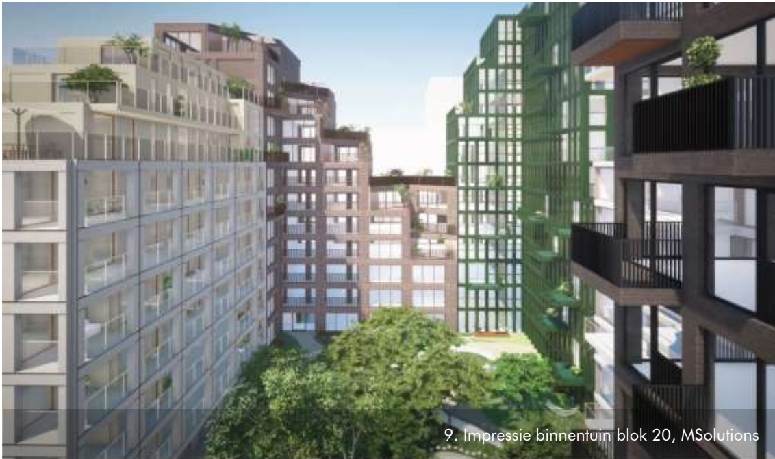
9. Impressie binnentuin blok 20, MSolutions

standaardpakket te behoren. Er wordt door de aanvrager nu vaak een landschapsarchitect aangetrokken voor het ontwerp van de binnentuin en terrassen.