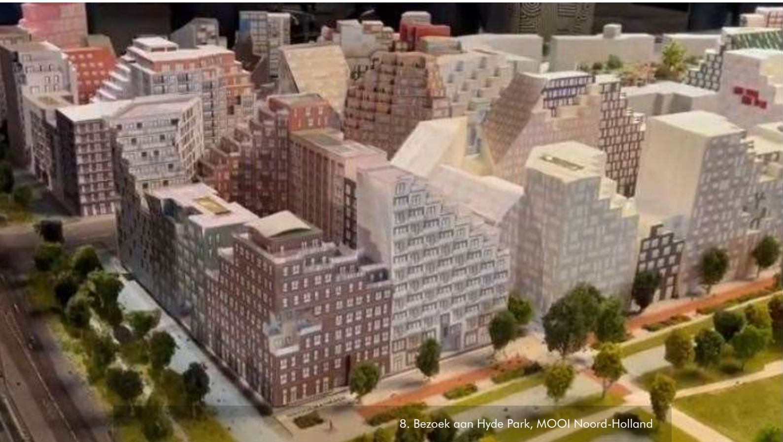
8. Bezoek aan Hyde Park, MOOI Noord-Holland