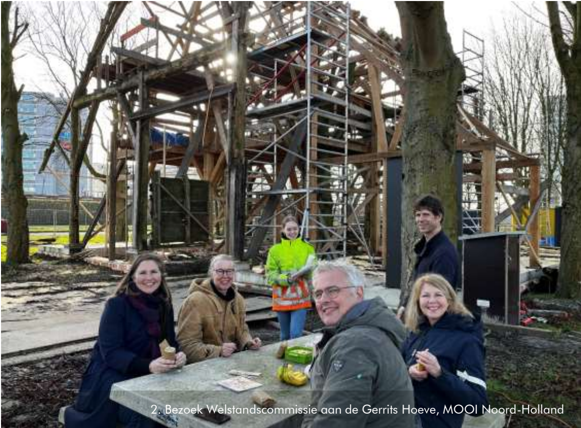
2. Bezoek Welstandscommissie aan de Gerrits Hoeve, MOOI Noord-Holland

geval van twijfel kan de gemandateerde terugvallen op de commissie. Werken onder mandaat komt in Haarlemmermeer bijvoorbeeld voor bij de beoordeling van kleinere plannen.