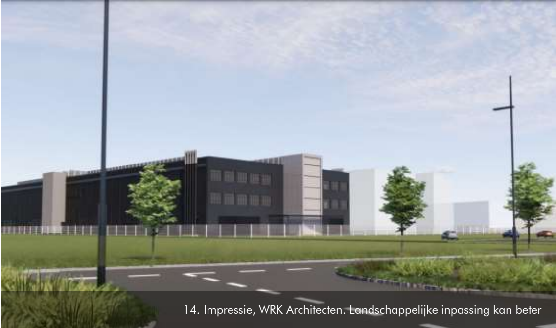
14. Impressie, WRK Architecten. Landschappelijke inpassing kan beter

Welstandscommissie kan echter op basis van de vigerende nota alleen aanbevelingen doen in de vorm van suggesties.