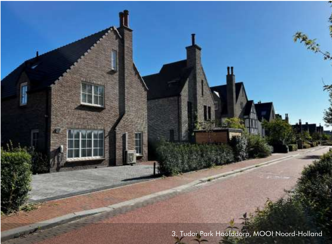
3. Tudor Park Hoofddorp, MOOI Noord-Holland