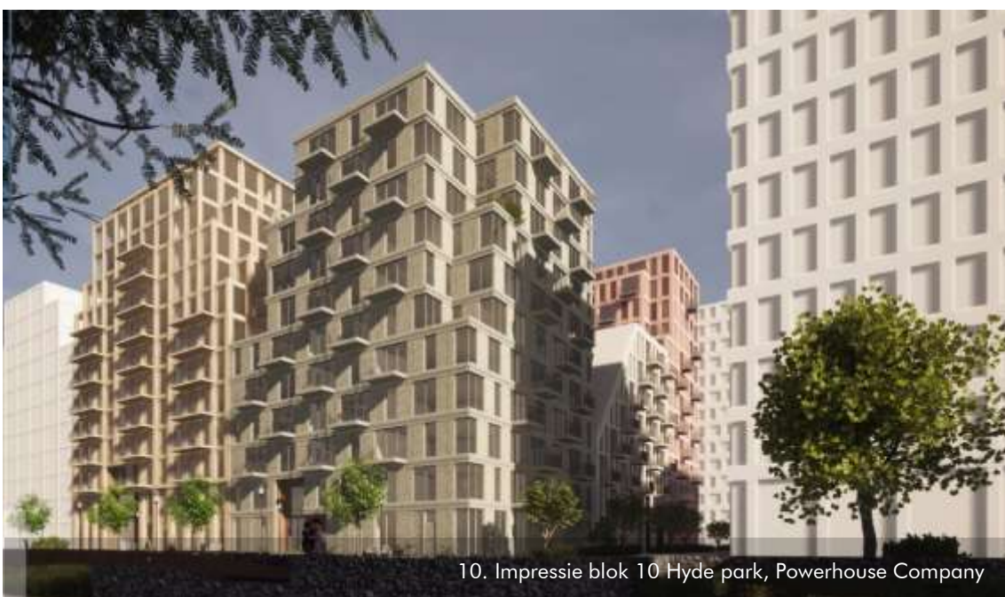
10. Impressie blok 10 Hyde park, Powerhouse Company