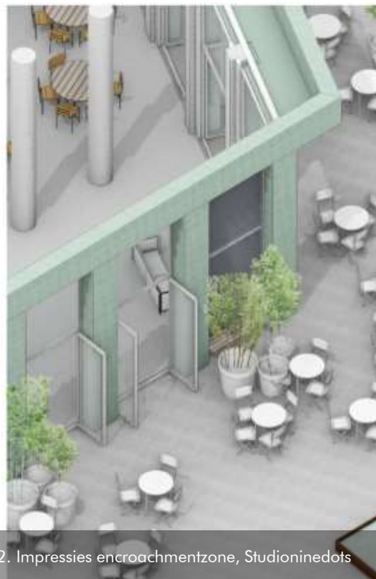
12. Impressies encroachmentzone, Studioninedots