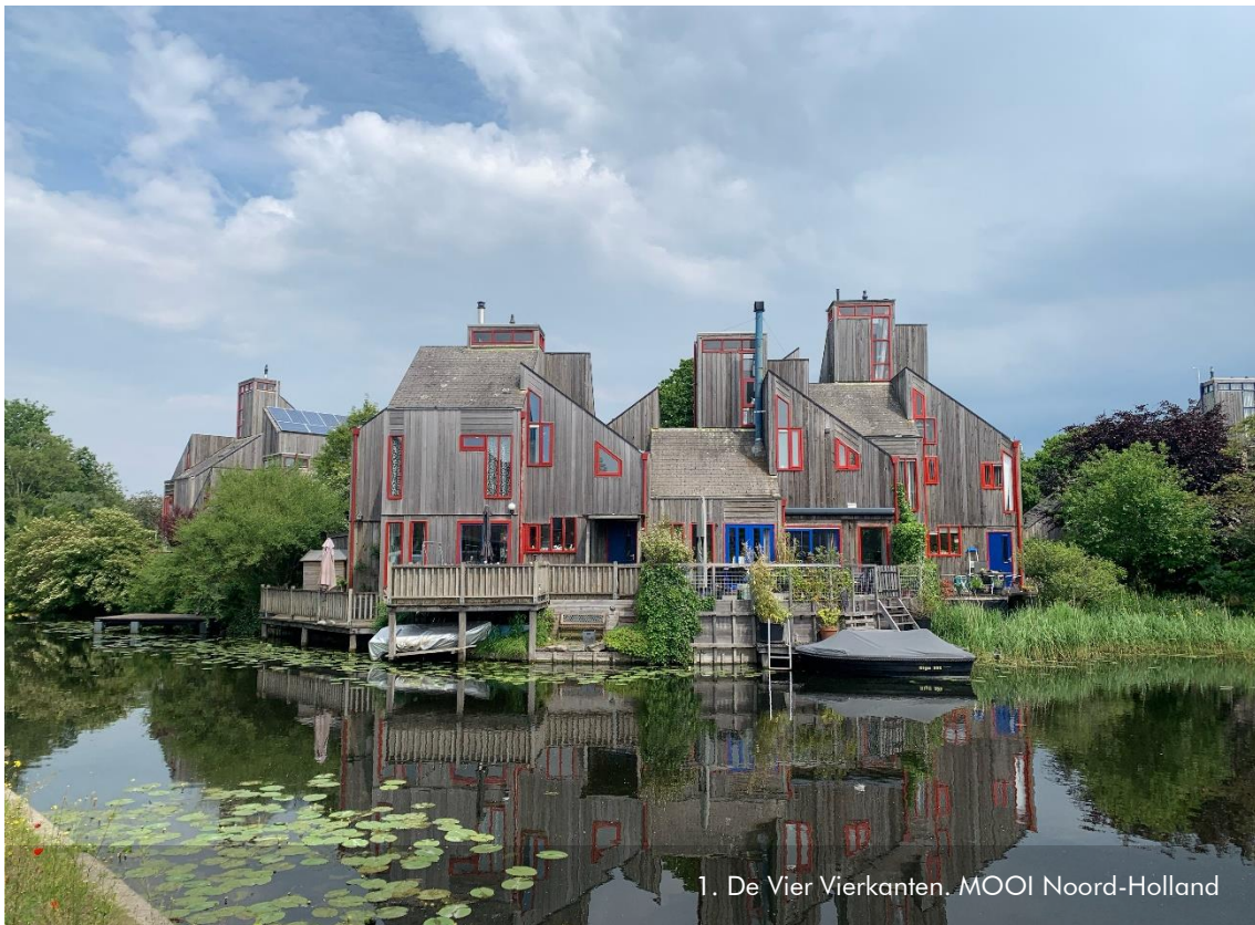
1. De Vier Vierkanten. MOOI Noord-Holland

voorzitter Welstands- en Monumentencommissie Alkmaar