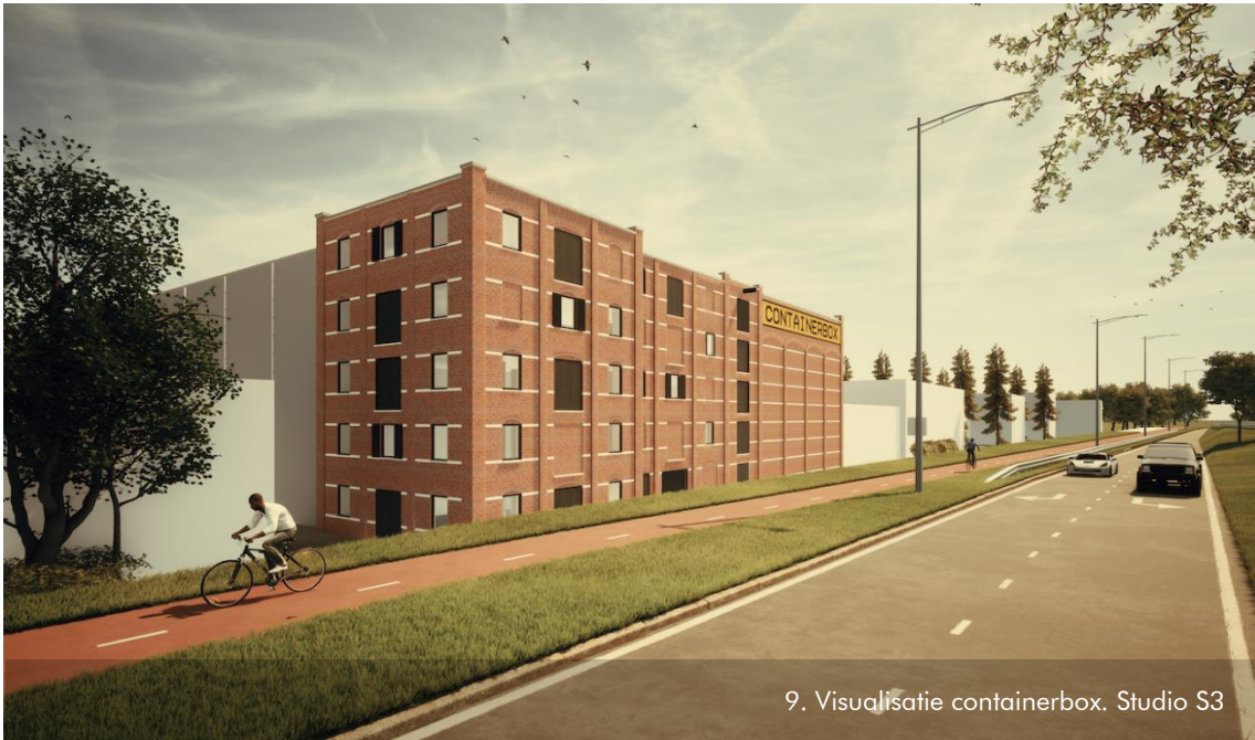
9. Visualisatie containerbox. Studio S3

De commissie heeft veel waardering voor dit initiatief. Zij heeft geadviseerd om de ramen doorzichtig te maken, zodat er vanaf de weg gezien een levendiger beeld ontstaat. Tevens zijn op aanraden van de commissie duidelijke details gemaakt waaruit blijkt dat aan het ambitieniveau van de opdrachtgever tegemoet wordt gekomen.