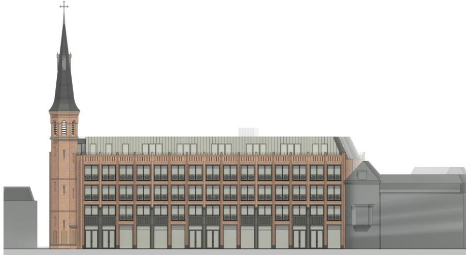
3. The Dome, aanzicht aan de Laat. KDRA architecten

Veel aandacht is gegaan naar de kwaliteit en het comfort van de nieuwe woonomgeving rondom de opgetilde daktuin, met waar mogelijk ruimte voor daglicht en groen. De commissie verheugt zich op deze nieuwe aanwinst voor de binnenstad!