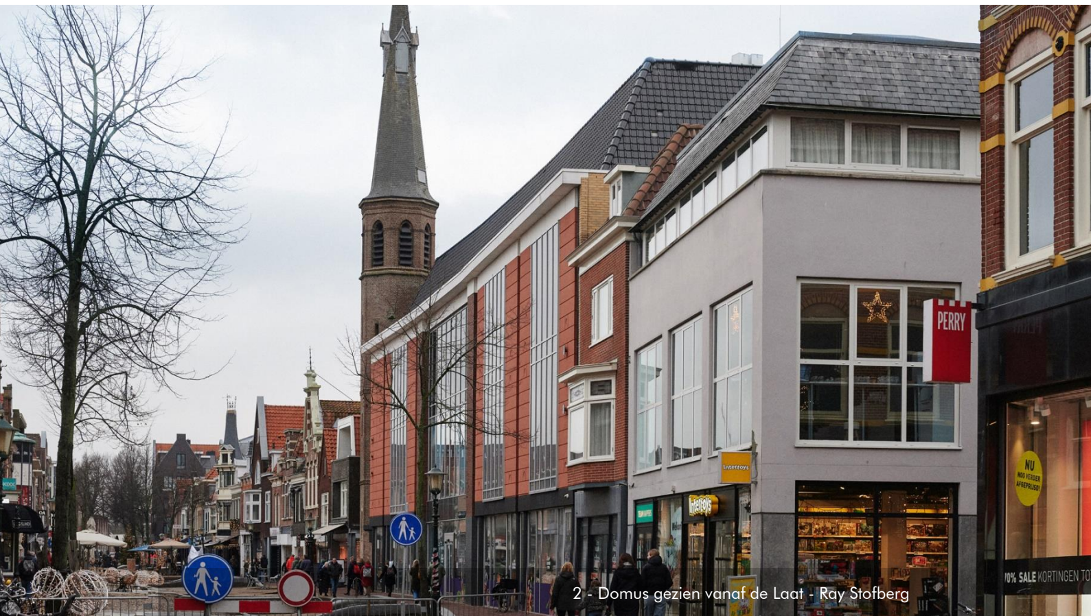
2 - Domus gezien vanaf de Laat - Ray Stofberg