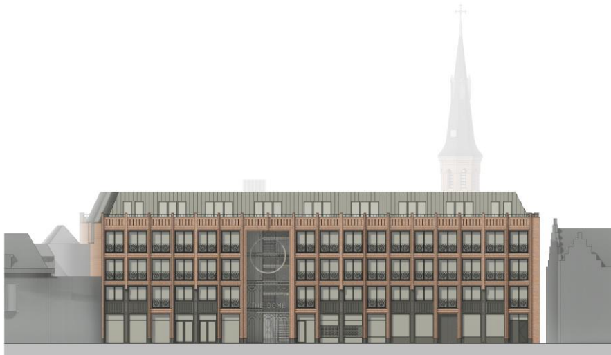
4. The Dome, aanzicht aan de Breedstraat. KDRA architecten