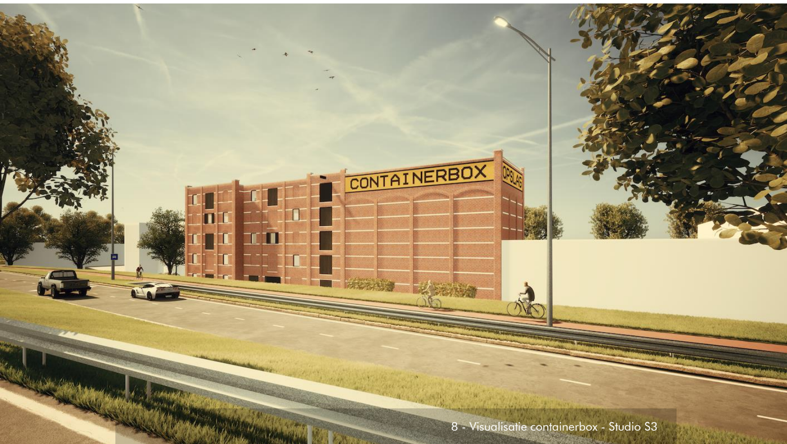
8 - Visualisatie containerbox - Studio S3