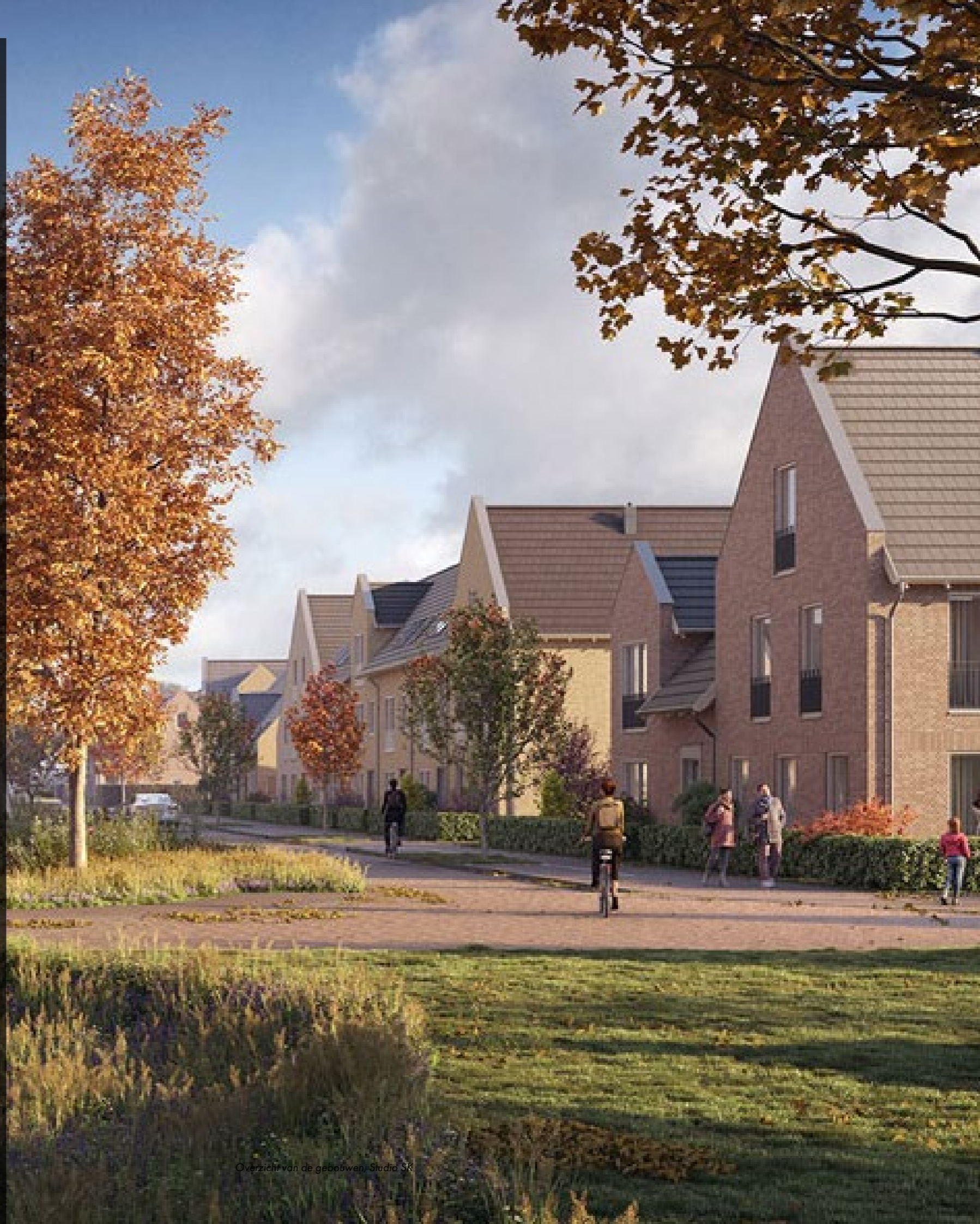
Overzicht van de gebouwen, Studio SK