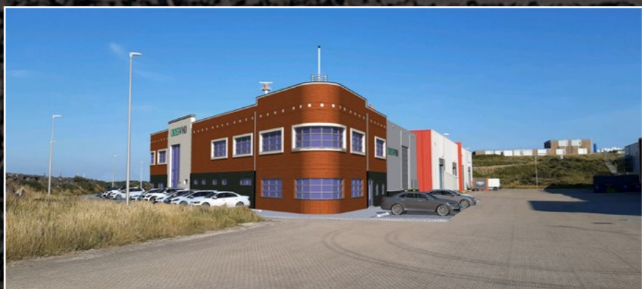
Havengebouw 1, 2, impressies Marchitectuur