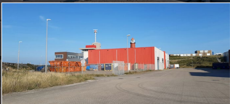
Havengebouw bestaand

De haven is de plek van grote bedrijvigheid en industrie. Efficiëntie en functionaliteit zijn hier leidend. Schoonheid is niet vanzelfsprekend. Soms zit schoonheid in de rauwe werkelijkheid en soms is er de ambitie om met aandacht een gebouw te maken dat onderscheidend is voor de werknemers. De commissie was aangenaam verrast door deze ambitie voor het havenkantoor. Het hoekpand zorgt voor een vloeiende overgang van de loodsen naar de kantoren. De entree is voornamelijk en sluit aan op het bestaande kantoor. Tegelijk heeft het gebouw een eigen karakter. Het is met recht een hoekpand dat markant is en twee werelden met elkaar verbindt.