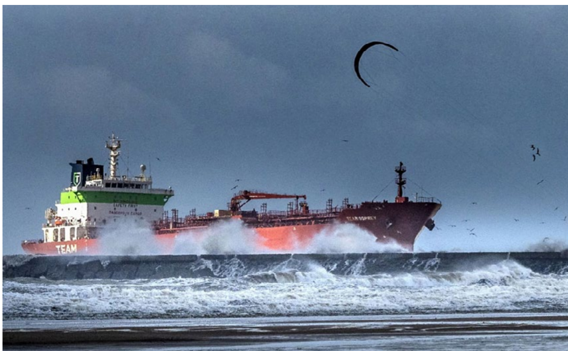
Umuideren Rauw aan Zee