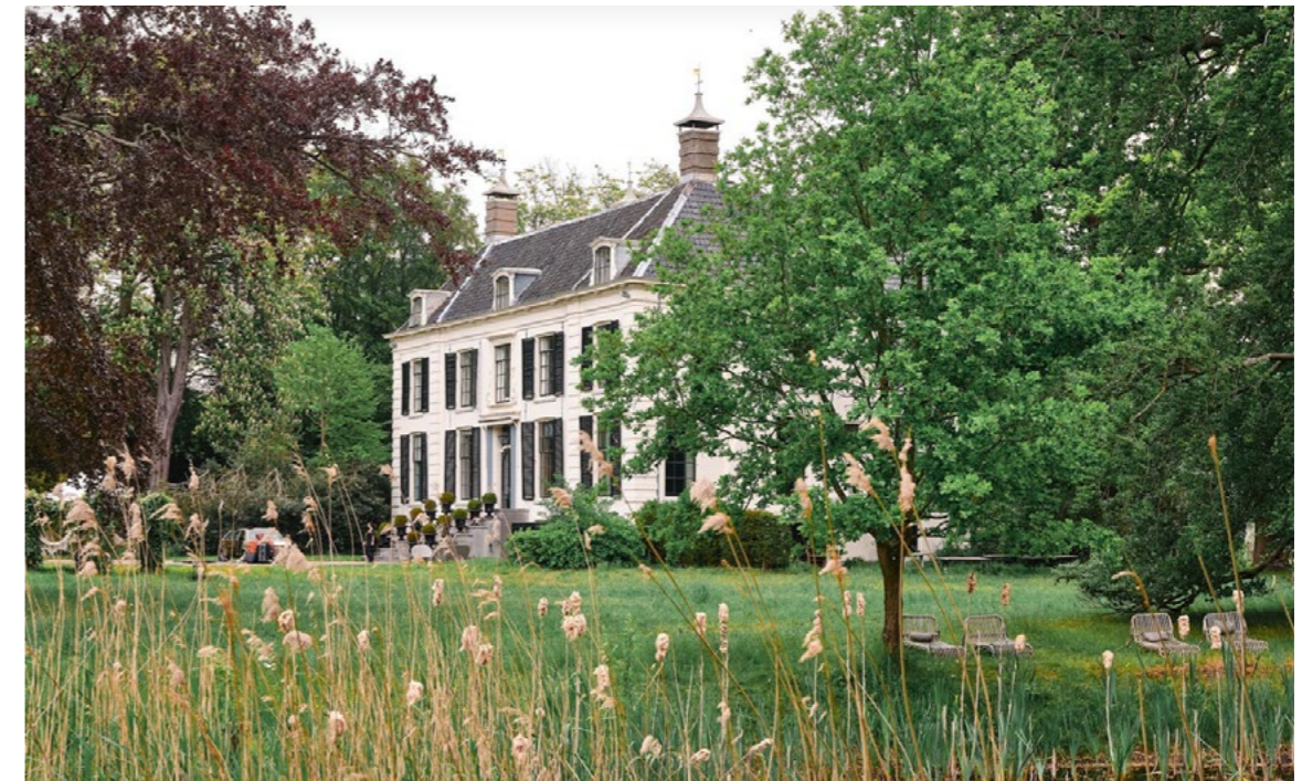
Bijzonder plan Landgoed Waterland

aandacht voor duurzaamheid, biodiversiteit, klimaatadaptatie, natuur inclusief bouwen, respect voor landschap, water en bodem, en op het sociale vlak toename van de aandacht voor participatie en kansgelijkheid. Het zijn onderwerpen die onze adviseurs zich als specialisten eigen maken om als vanzelfsprekend bij de advisering te betrekken.