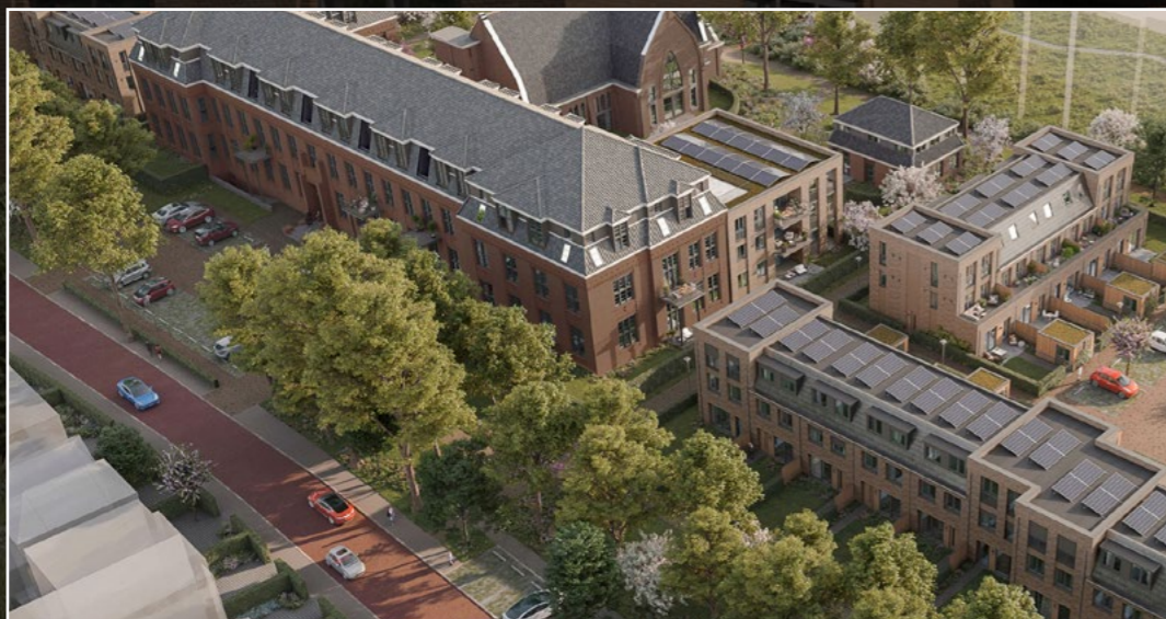
Impressies en foto van Ommeren Architecten en Thijs Asselbergs architectuurcentrale