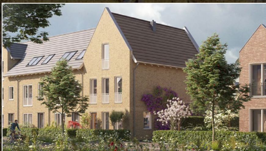
Impressies Mulleners & Mulleners