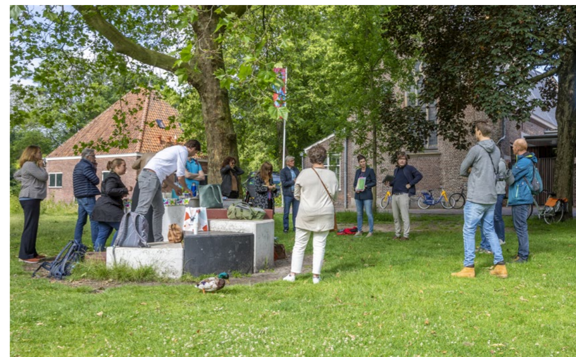
Op 24 juni organiseerde het Steunpunt Monumenten & Archeologie Noord-Holland een excursie in Haarlem waar de adviseurs van de afdeling erfgoed hebben verteld over de omgevingsvisie.

De nieuwe gemeenteraad zal in 2022 de gemeentelijke adviescommissie instellen. Wellicht een mooie gelegenheid om met de adviseurs in deze commissie kennis te maken. Bijvoorbeeld via een bezoek aan de