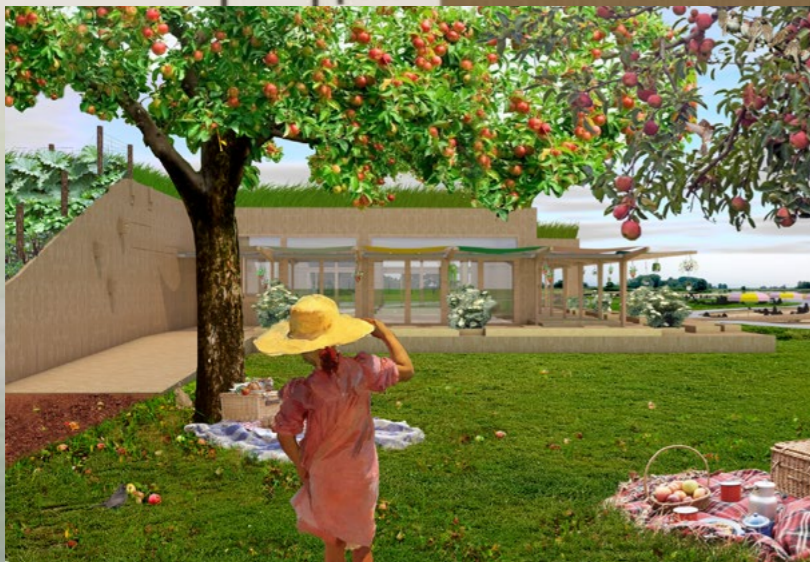
Render Veerkwartier met boomgaard. Beeld: HER architecten