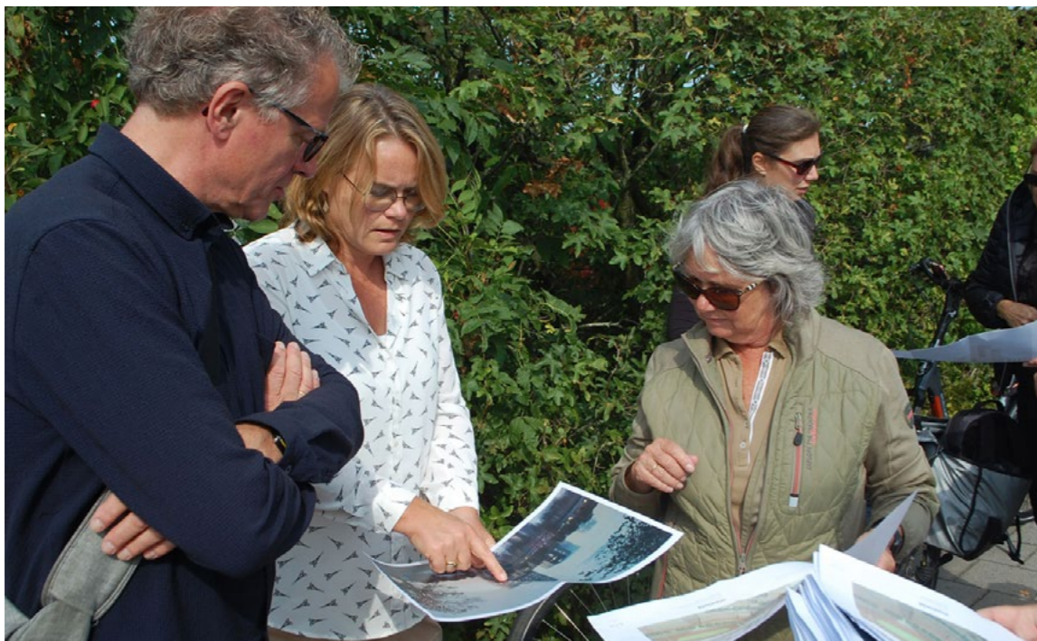
De ARK op excursie door de Europazone met de leden van het supervisieteam.

massaal, hard karakter en mistte het een zekere lichtheid, variantie en aandacht voor de menselijke maat. Inmiddels wordt gewerkt aan planaanpassingen om aan de bezwaren van de commissie tegemoet te komen.