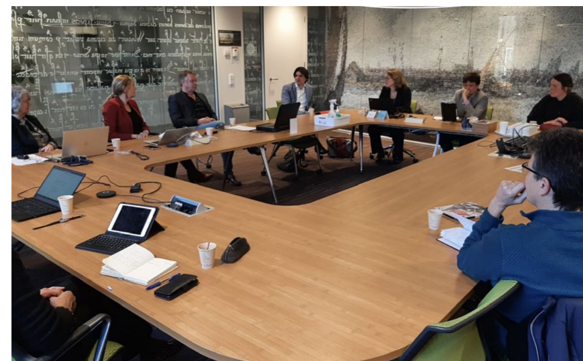
Op maandag 28 februari was het wethoudersgesprek met de afdelingshoofden van VTH, OMB en Ontwerp. Na afloop vergaderde de ARK voor het eerst op locatie.

mogelijk is op dat gebied, en kan op die manier inwoners en ondernemers nog vaker inspireren.