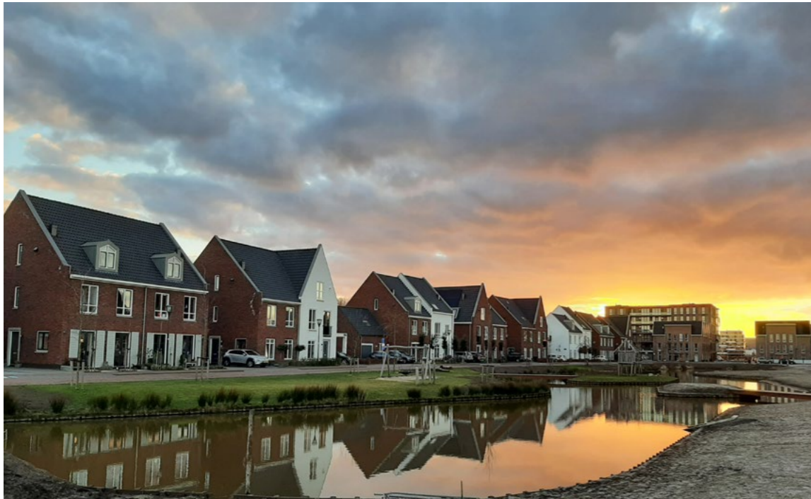
Zonsondergang in het Vijverpark.

erfgoed specialisten bij gemeenten. Toch pleiten we er voor de erfgoed specialisten ook in te zetten bij ontwikkelingen waar dat niet direct evident is, zoals gebiedsontwikkelingen in naoorlogse wijken, waar wel degelijk cultuurhistorische waarden in het geding zijn. Met het Steunpunt Monumenten & Archeologie Noord-Holland proberen we waar het kan binnen bepaalde grenzen ondersteuning te bieden. Laat vooral weten wanneer hulp gewenst is.