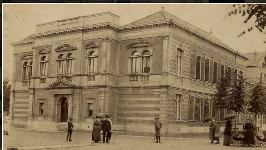
De Opleidingschool voor Meisjes aan de Prins Hendrikstraat. Gezien op vanaf de Wilhelminastraat hoek Prins Hendrikstraat. Identificatienummer 54-000820.

Na de laatste vergadering heeft er correspondentie plaatsgevonden tussen de architect en de ARK over de Franse luiken aan zijde van de Wilhelminastraat. De commissie had haar bedenkingen bij de toepassing van verlengde scharnieren omdat dat te sterk afwijkt van de oorspronkelijke uitvoering van de luiken. Bovendien zouden de beoogde luiken niet functioneel worden. Uiteindelijk is besloten om af te zien van de luiken. Een verbetering, omdat zo het zicht op de decoratieve raamomlijstingen is behouden en tevens het trottoir vrij gehouden voor voetgangers.